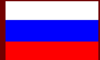
Флаг Российской империи

Российская империя во время её наибольшей внешней экспансии ( 1790 Российская империя во время её наибольшей внешней экспансии (1790- 1860 ). Светло-зелёным цветом показана сфера русского влияния.