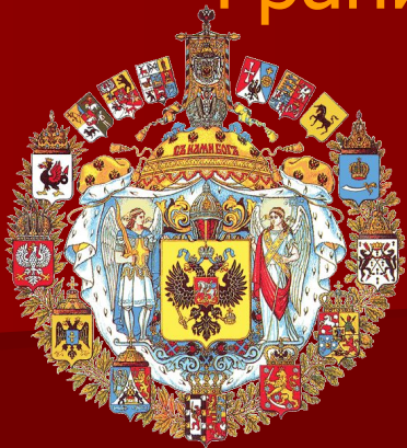
Большой герб Российской империи