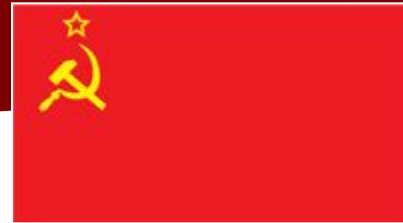
Флаг и герб СССР