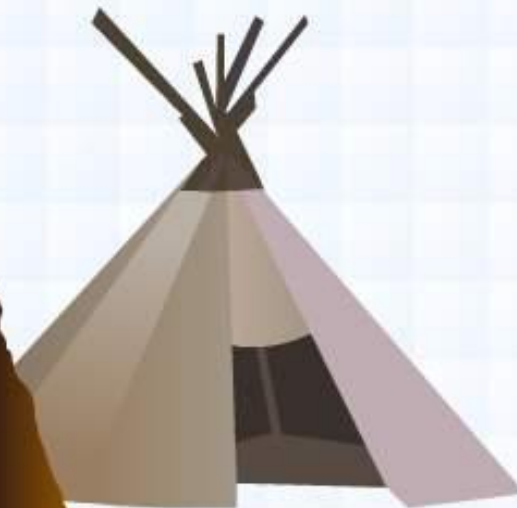
чум и одежда из оленьих шкур