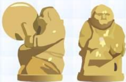
статуэтки из бивней моржа