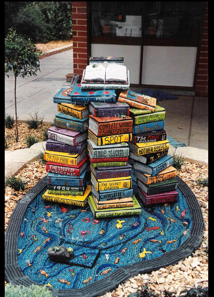
Памятник на Балаклавской улице в Австралии