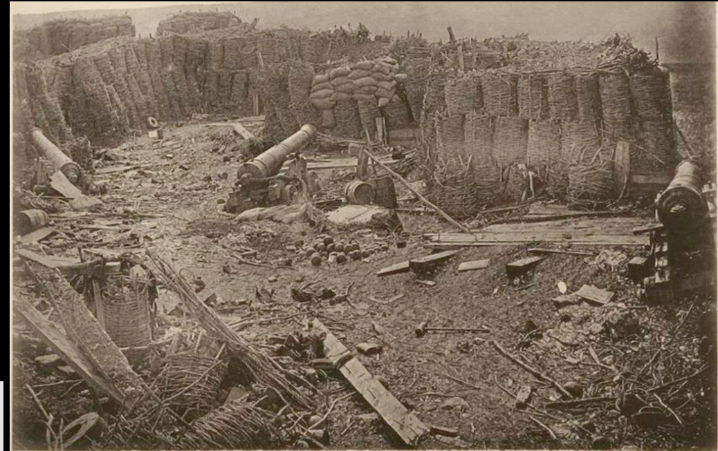
Батарея на Малаховомъ курганѣ.

Город образован 8 ноября 1883 года отделением части города Ванв. Город был назван в честь маршала Жан-Жака Пелисье.