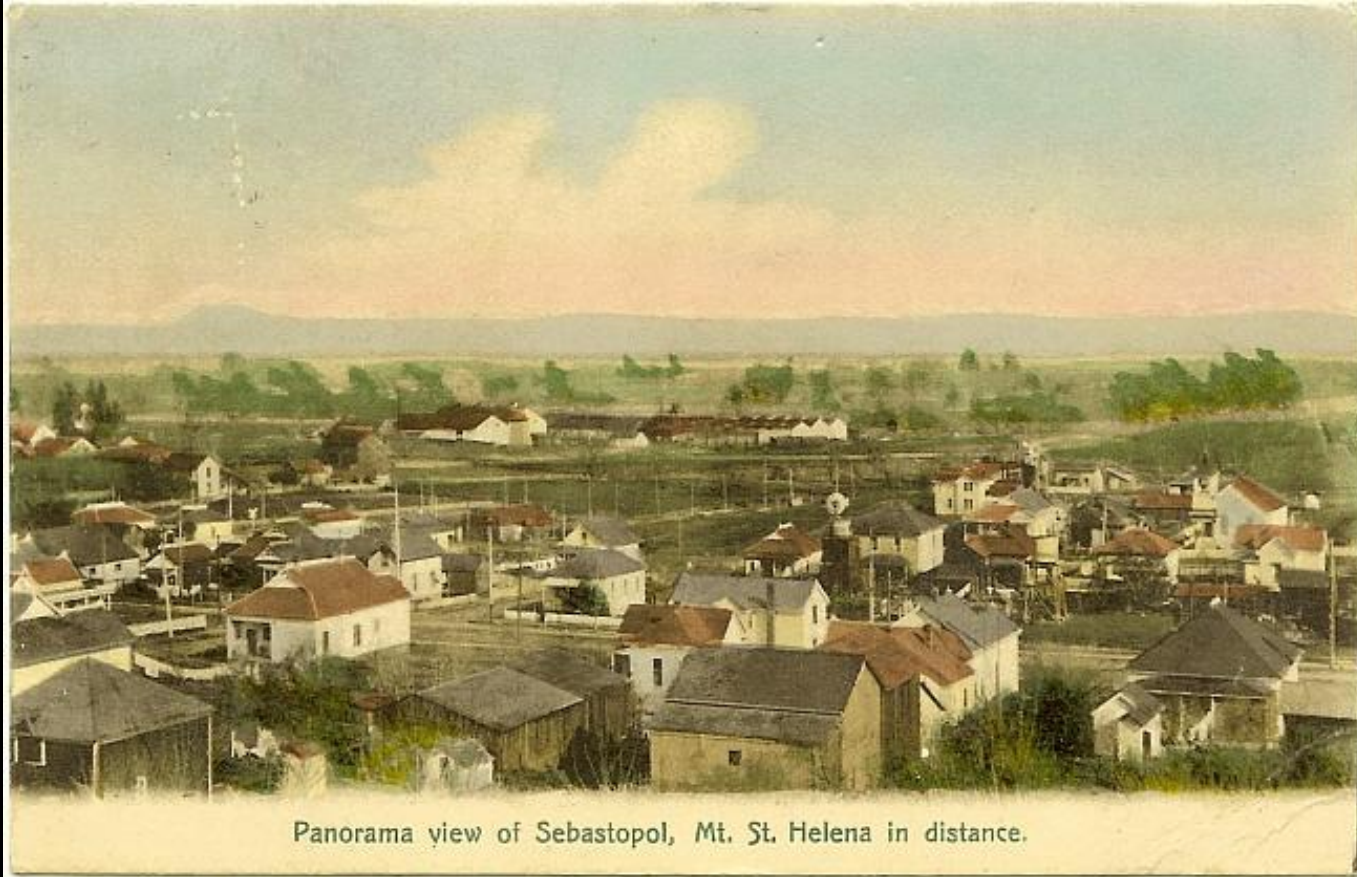
Panorama view of Sebastopol, Mt. St. Helena in distance.