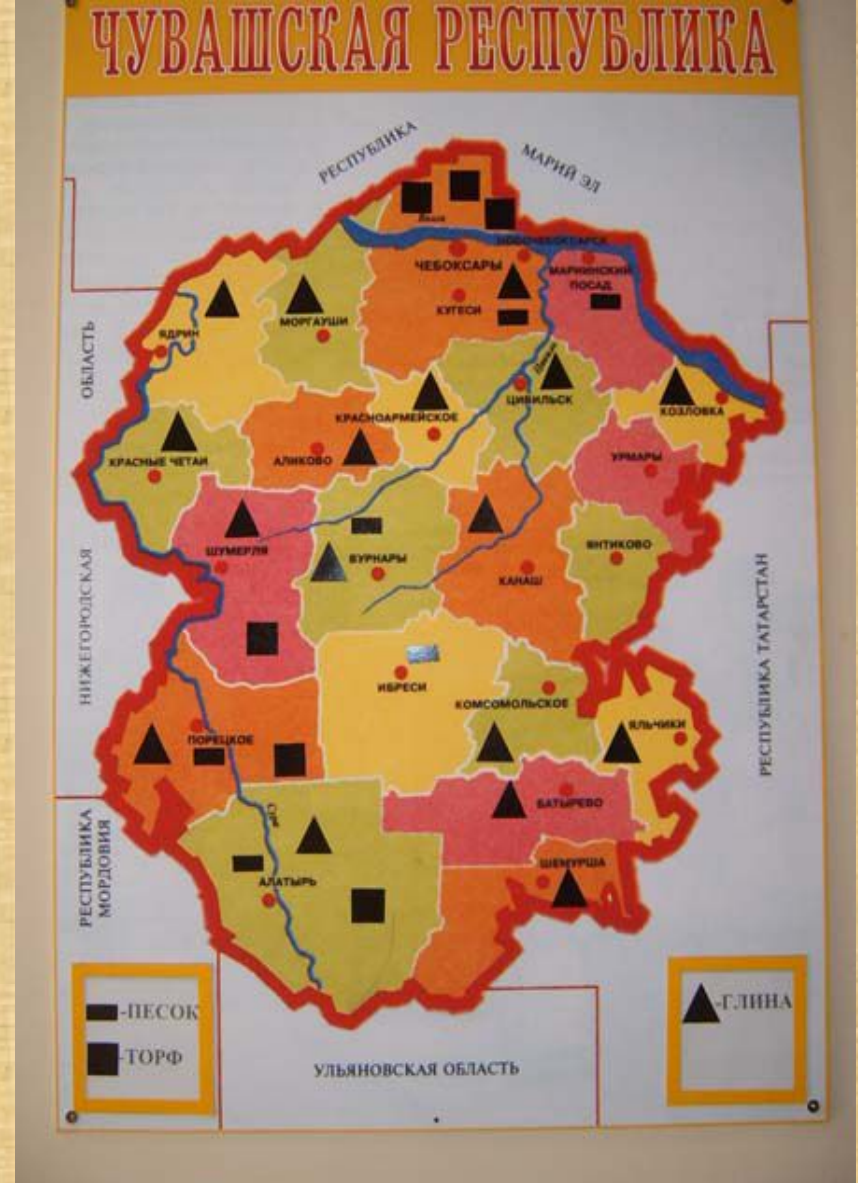
Биологическая карта Чувашии Полезные ископаемые Чувашии