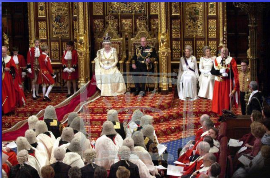
No:462053.01 Date:14.11.2002 Headline:LONDON : THE STATE OPENING OF PARLIAMENT... Caption: THE QUEEN SPEECH AT THE STATE OPENING OF PARLIAMENT...