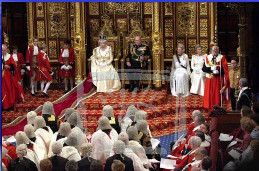
No:462053.01 Date:14.11.2002 Headline:LONDON : THE STATE OPENING OF PARLIAMENT... Caption: THE QUEEN SPEECH AT THE STATE OPENING OF PARLIAMENT...