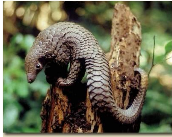
Африканский древесный ящер