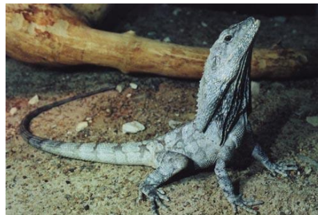
Австралийская плащеносная ящерица