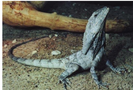
Австралийская плащеносная ящерица