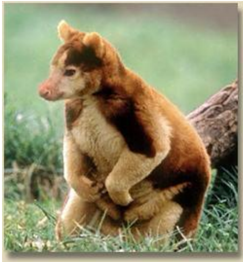
Красноногий древесный кенгуру