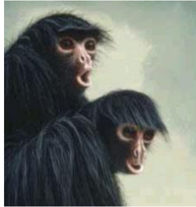
Паукообразная чернорукая обезьяна