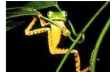
Зеленая древесная лягушка