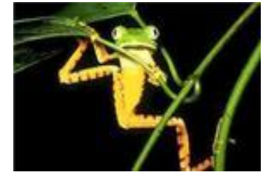
Зеленая древесная лягушка