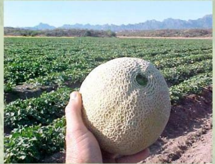
Земледелие в Средней Азии.

Население Центральной Азии занимается в основном кочевым скотоводством. В пустынях разводят верблюдов и овец, в степях Монголии занимаются коневодством, в горах выращивают коз и яков. Лишь в долинах рек и оазисах развито земледелие - там выращивают зерновые и бахчевые культуры, хлопчатник.