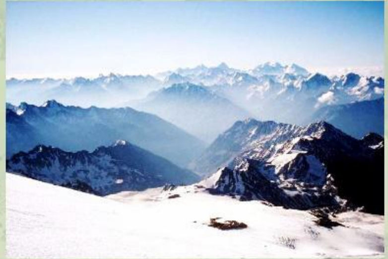
Горы Средней Азии.

Горы региона отличаются большой высотой и суровым климатом. Равнинные участки Центральной Азии заняты в основном пустынями и полупустынями. Столь сложные природные условия наложили отпечаток и на население региона.