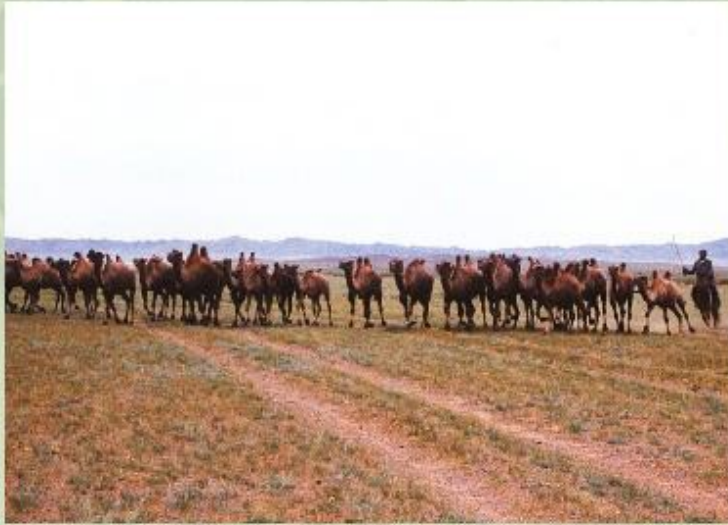
Скотоводство в Монголии.