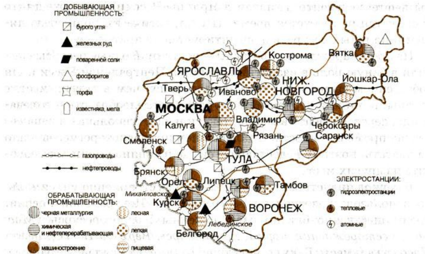
155. Центральная Россия