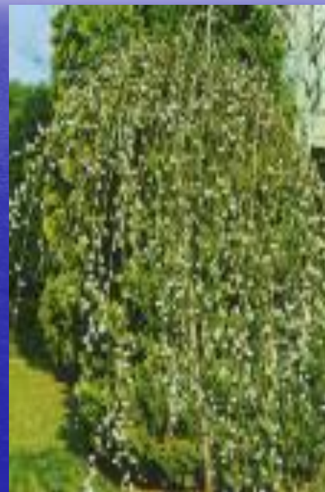
ива ( Salix arctica )