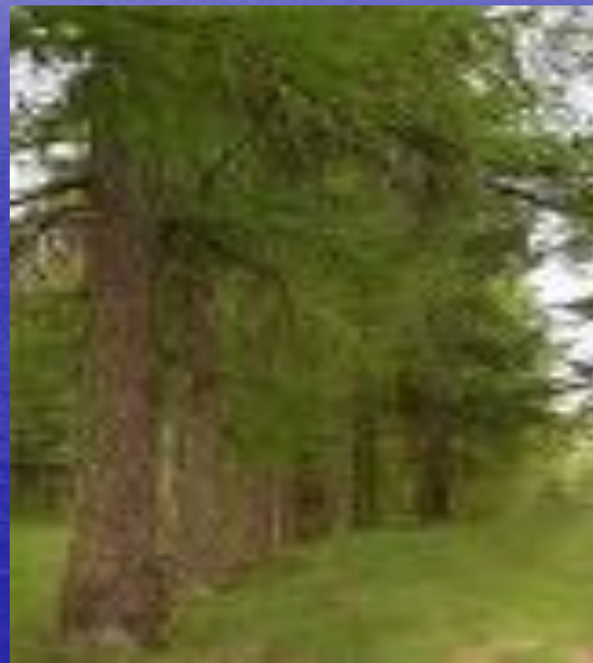
сибирская лиственница ( Larix sibirica )