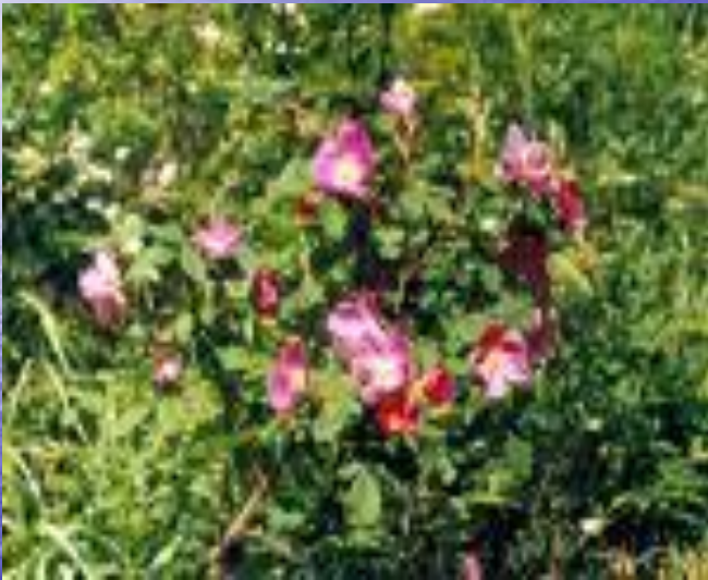
шиповник иглистый ( Rosa acicularis )