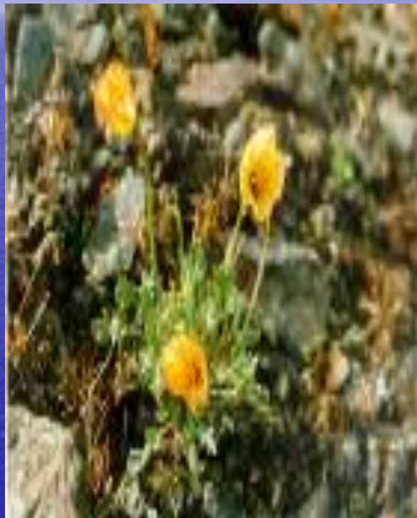
мак ( Papaver polare )