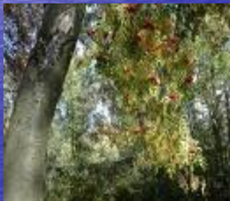
груша русская ( Pyrus rossica )