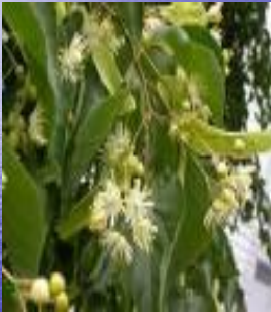
липа сердцевидная ( Tilia cordata )