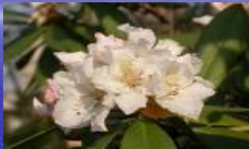
кавказский рододендрон ( Rhododendron caucasicum )