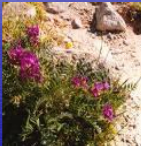
астрагал ( Astragalus ).