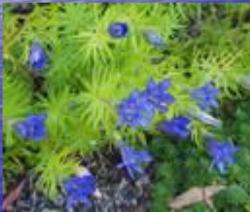
парадоксальная генциана ( Gentiana paradoxa )