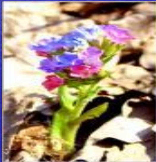
род Pulmonaria (медуница) семейство геснериевых — Ramonda