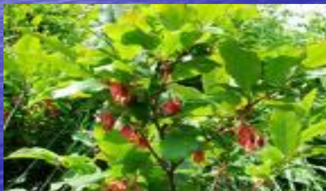
древовидная черника ( Vaccinium arctostaphylos )