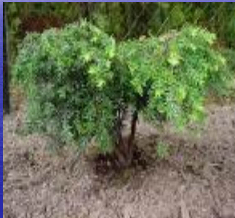
канадская цуга ( Tsuga canadensis )