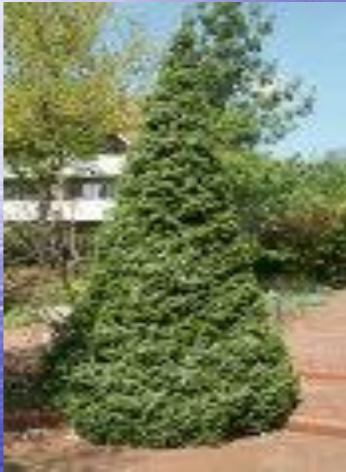
ель Picea omorika