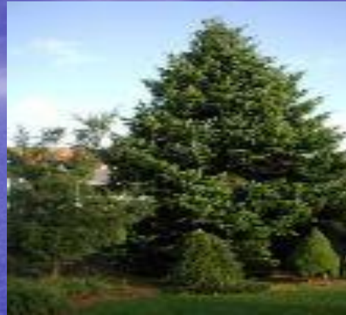
пихта Нордмана ( Abies nordmanniana )