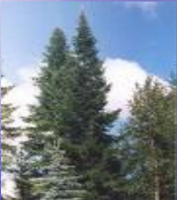
сибирская пихта ( Abies sibirica )