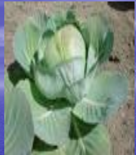
Borodinia · Botscantzevia