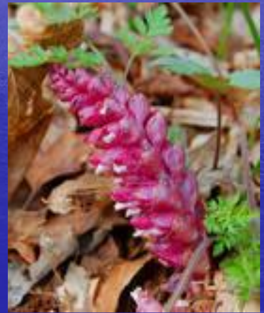
петров крест ( Lathraea rhodopea )