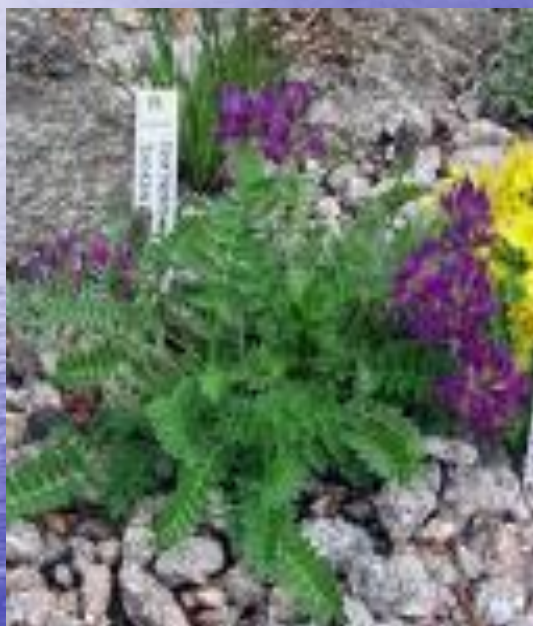
остролодочник ( Oxytropis )