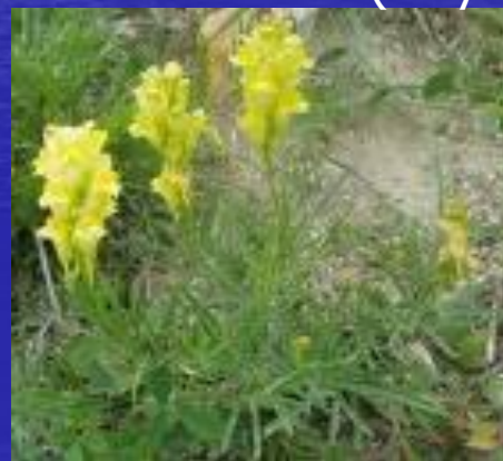
льнянка ( Linaria cretacea )