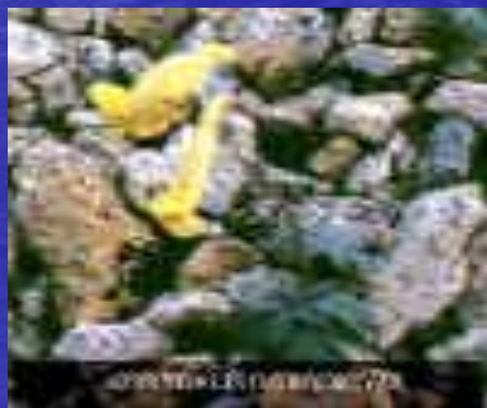
хохлатка Городкова ( Corydalis gorodkovii )