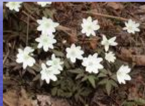
ветреница ( Anemone uralensis )