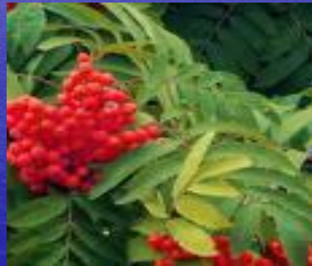
сибирская рябина ( Sorbus aucuparia subsp. sibirica ).