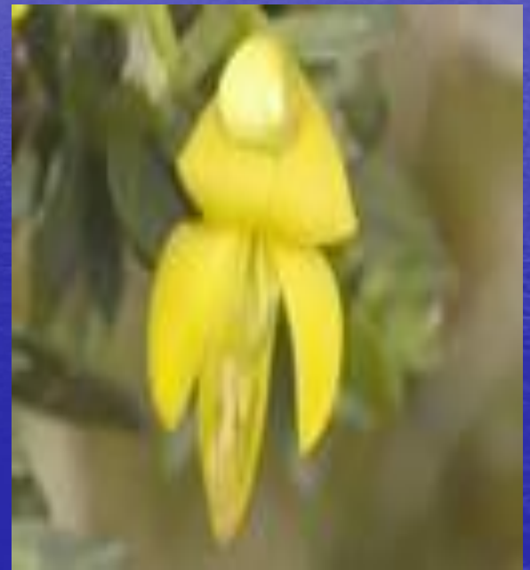
английский дрок ( Genista anglica ),