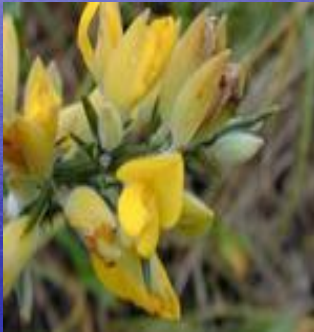
европейский утесник ( Ulex europaeus )