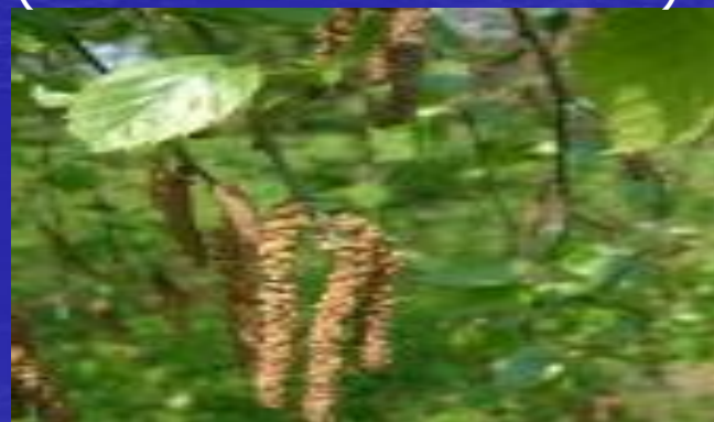
береза Радда ( Betula raddeana )