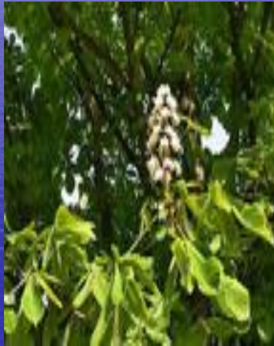
конский каштан ( Aesculus hippocastanum ),