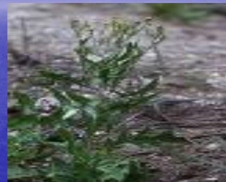
гулявник волжский ( Sisymbrium wolgensis )