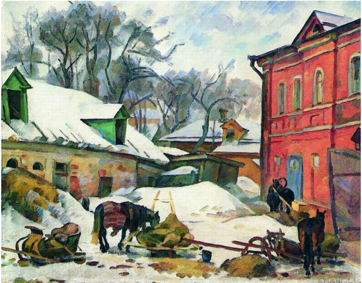
Покаржевский Петр Дмитриевич. Тульский дворик. 1919