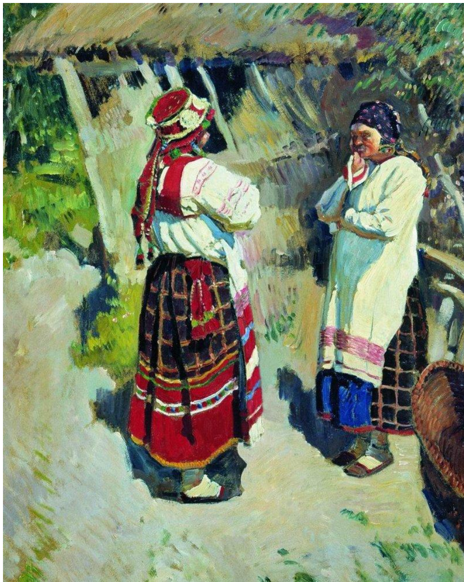
Виноградов Сергей Арсеньевич. Бабы тульские.