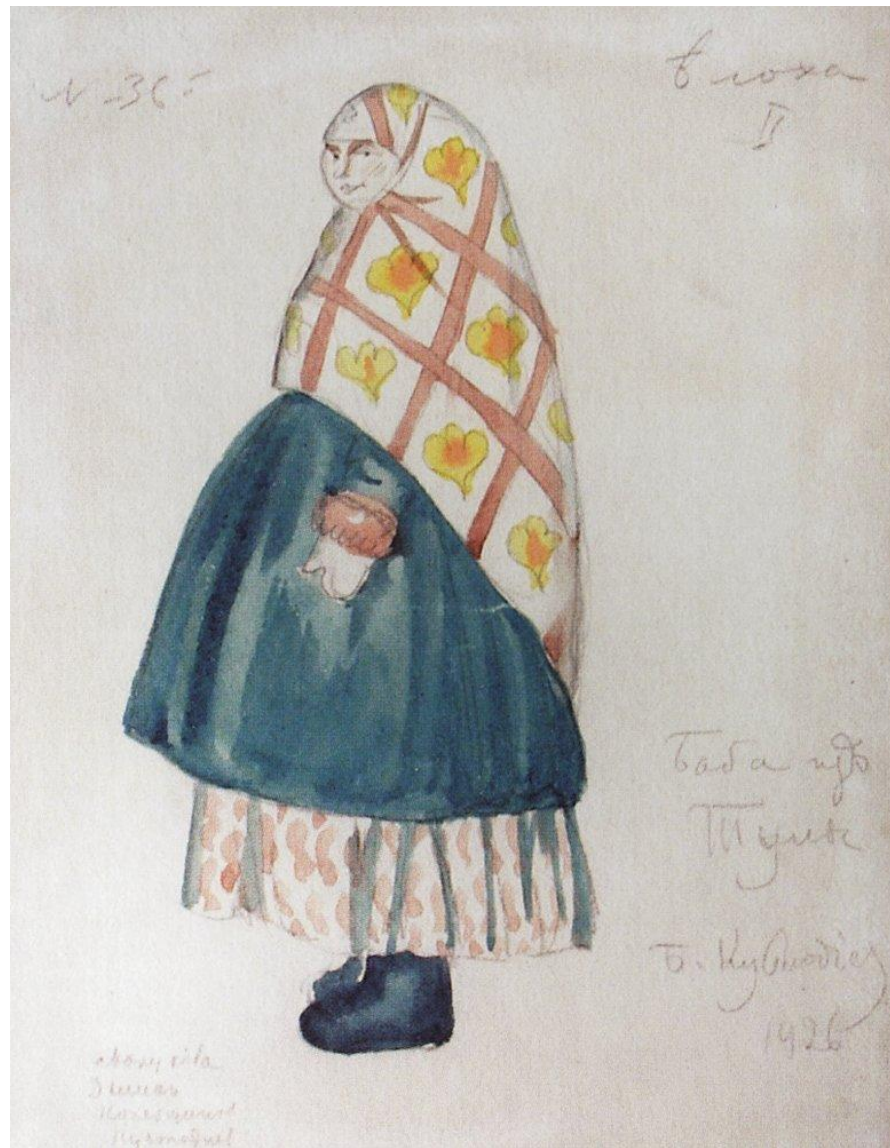
Кустодиев Борис Михайлович. Баба из Тулы.