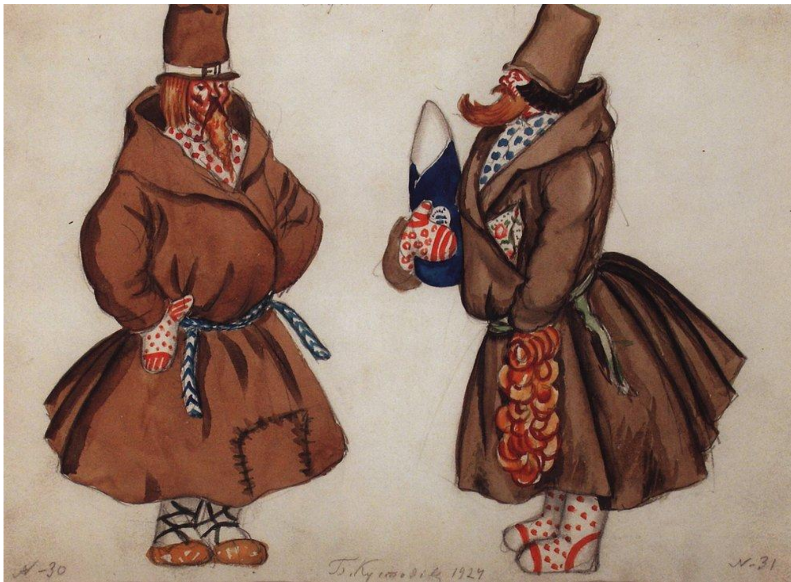
Кустодиев Борис Михайлович. Мужики-туляки. 1924