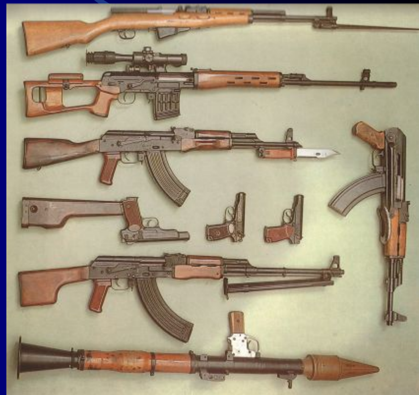
Советское стрелковое оружие