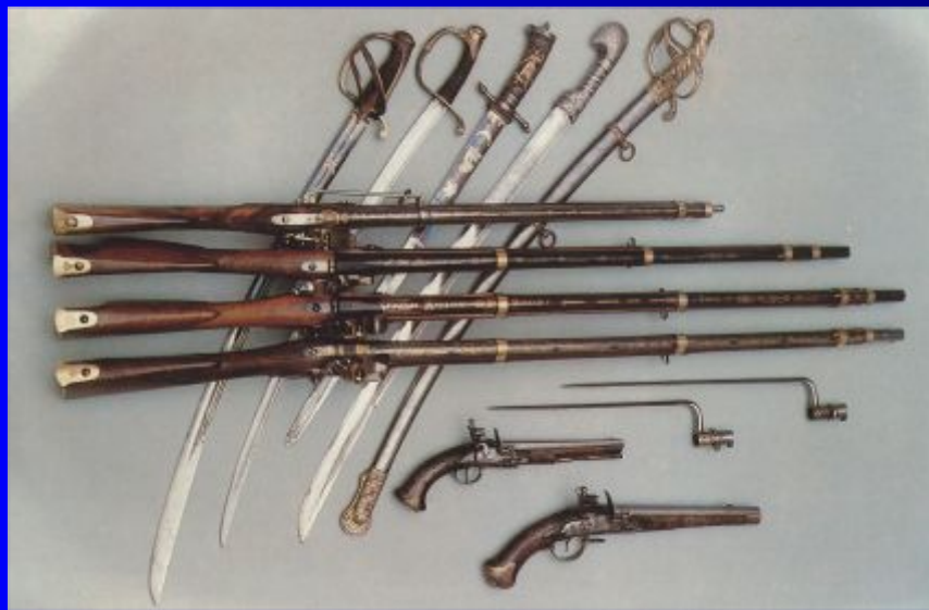
Холодное и огнестрельное оружие (XVIII-XIX века)

С 16 века Тула - кузница русского оружия. С тех самых пор тульские оружейники стали вооружать русскую армию пушками, ружьями.