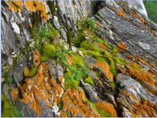
лишайники и мхи