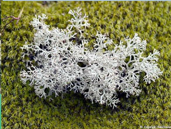
Олений лишайник (ягель)