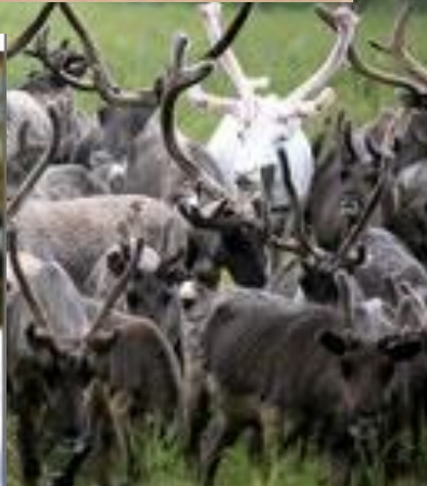
Полярная олени сова