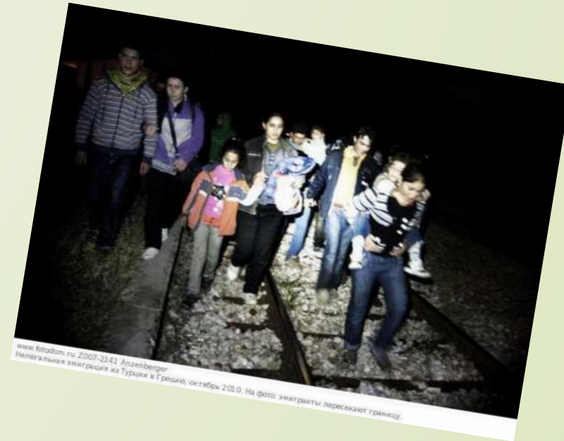
Незаконная эмиграция из Турции в Грецию, октябрь 2010. На фото: эмигранты, пересекают границу.