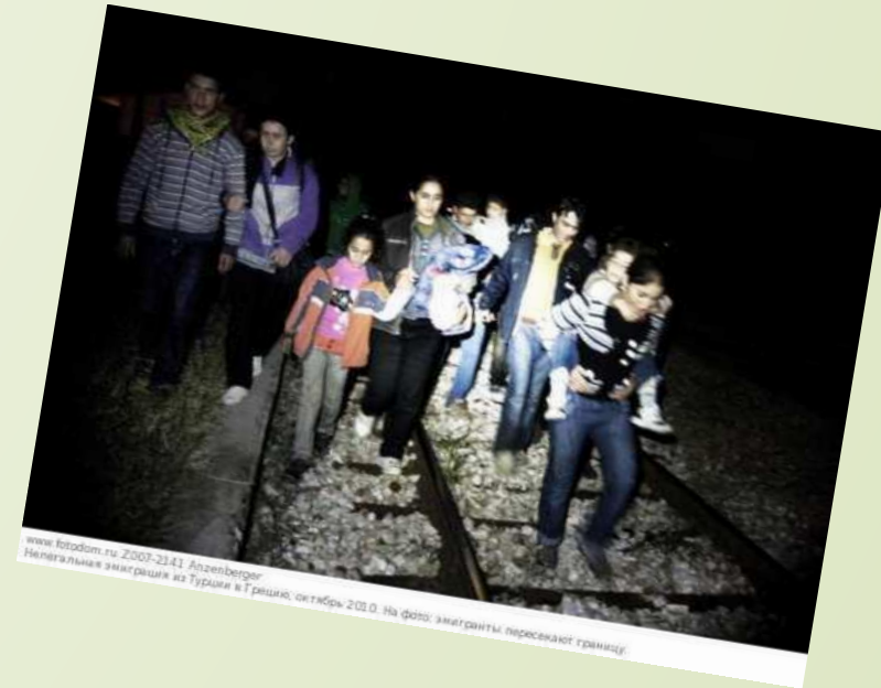
Незаконная эмиграция из Турции в Грецию, октябрь 2010. На фото: эмигранты, пересекают границу.