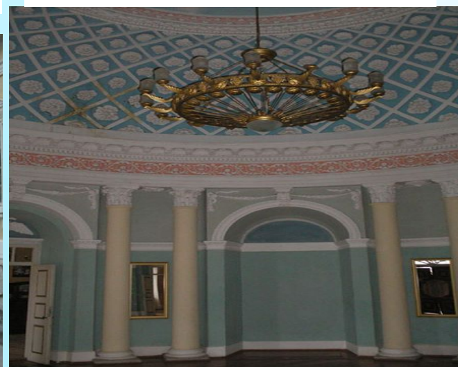
У блакитній залі Палацу Чечелів у Самчиках.