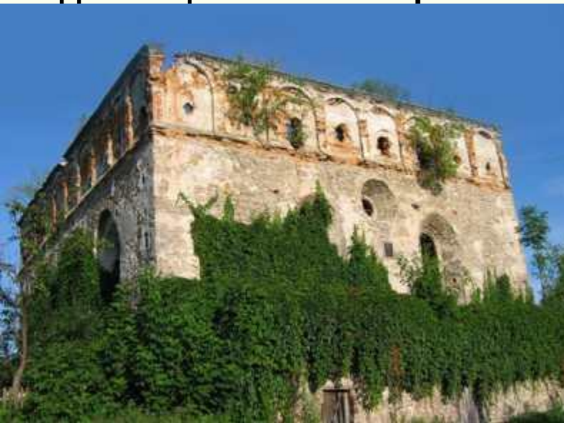
Синагога 1532 р.