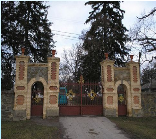
Вхід до заповідника «Самчики»