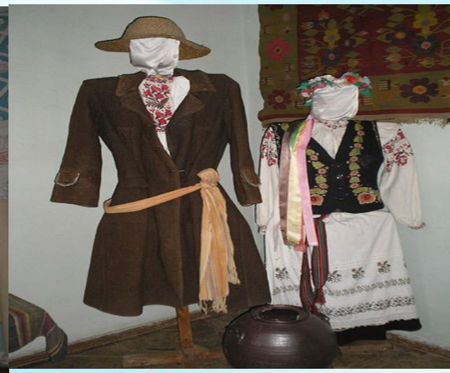
Одяг молодих експонат у заповіднику Самчики