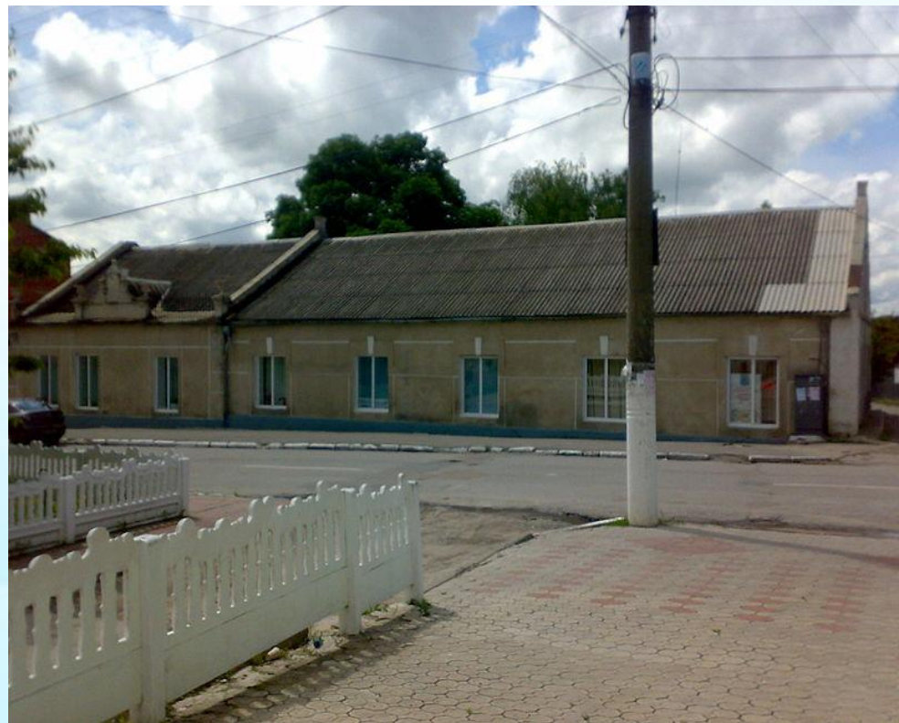
Дунаєвський районний історико-краєзнавчий музей