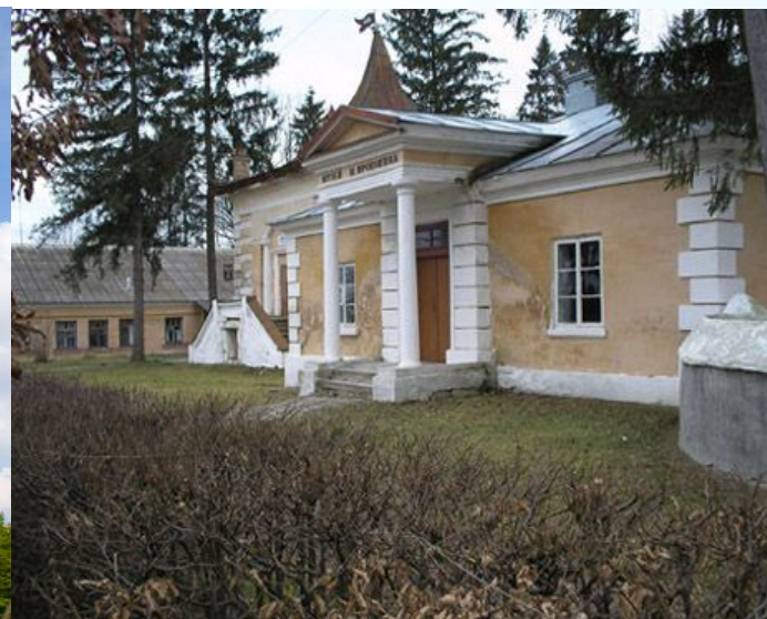
Музей Прокоп'юка у Самчиках