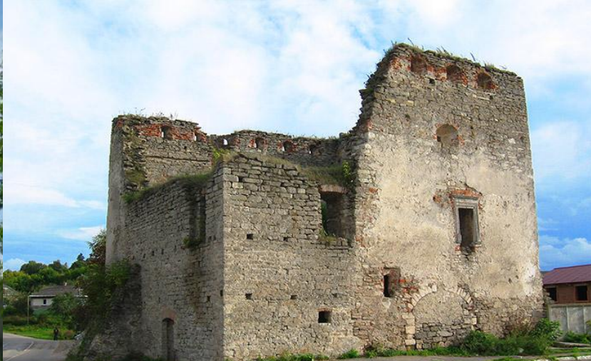
Міська брама 1553 р.