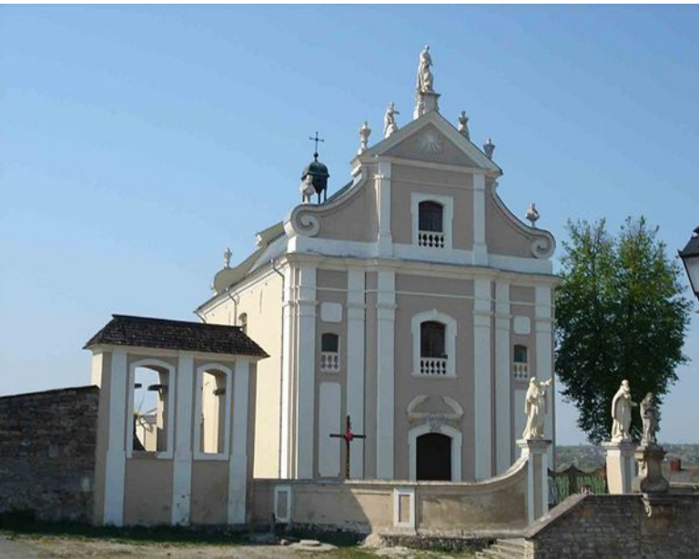
Тринітарський костел у Кам'