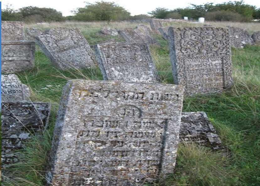
Єврейське кладовище XV-XIX ст.