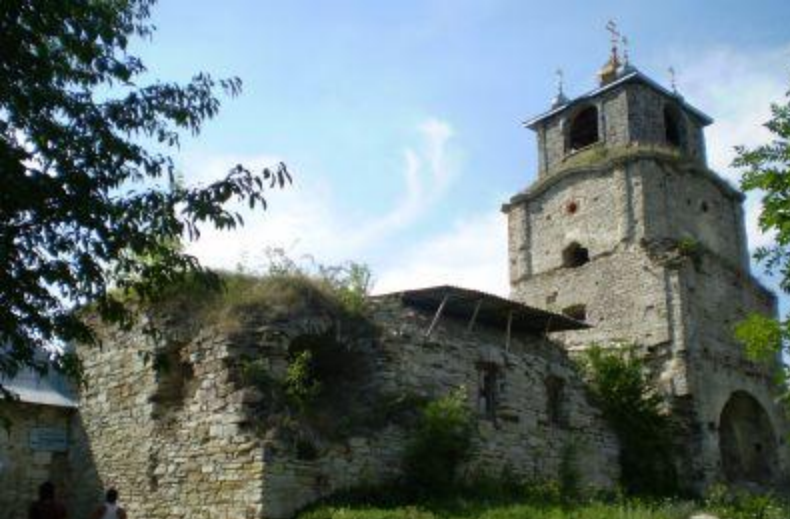
Свято-Троїцька церква, дзвіниця і келії 1654 р.