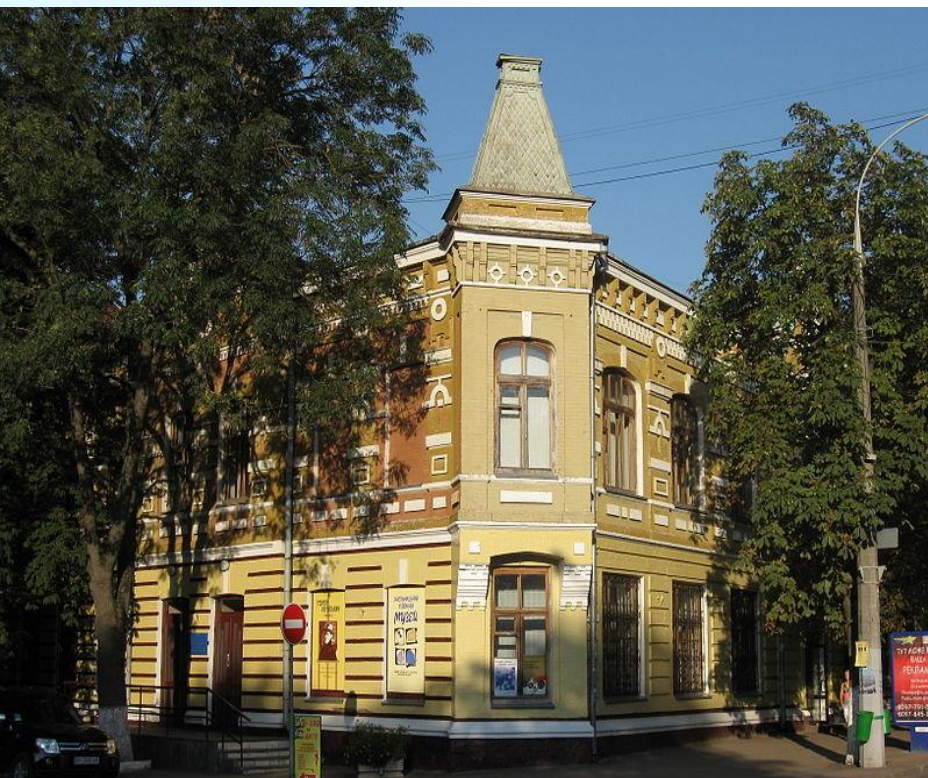
Хмельницький обласний художній музей