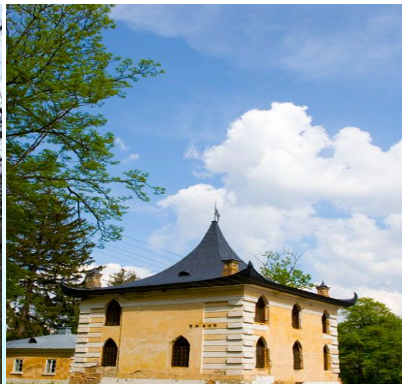
Китайський будиночок у Самчиках.