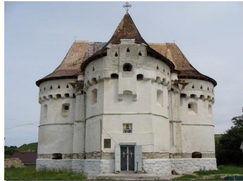
Покровська церква-фортеця. Сутківці