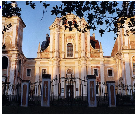
Костел Святого Йосипа. Ізяслав