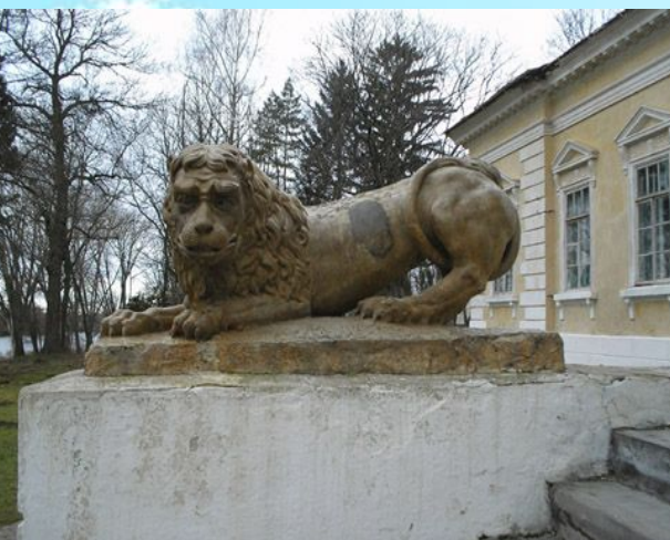
Скульптура «Лев, що сміється» біля палацу.