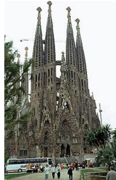
Испания Саграда Фамилия (храм Святого Семейства)