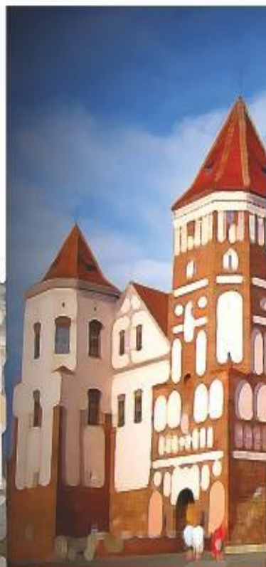
Замковый комплекс «Мир»