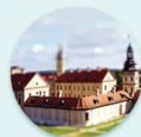
Национальный историко-культурный музей-заповедник "Несвиж"