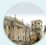
Гомельский дворцово-парковый комплекс