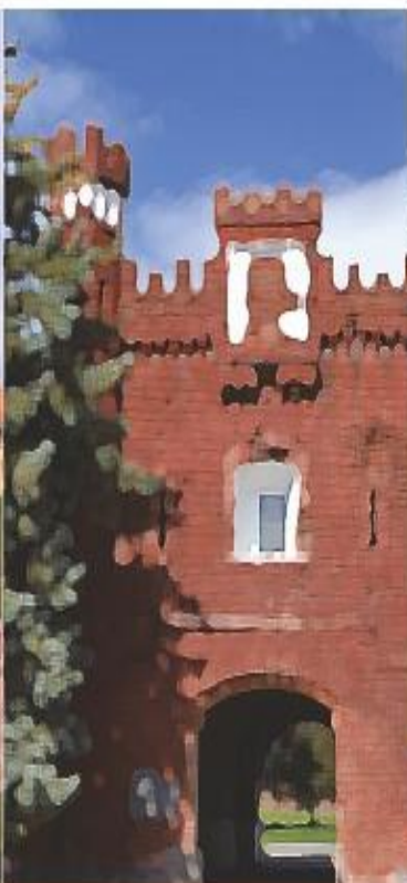
Комплекс «Брестская крепость-герой»