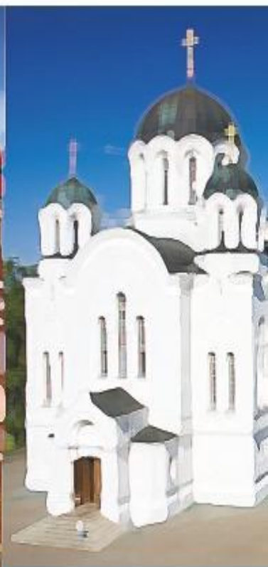
Полоцкий историко- культурный музей- заповедник