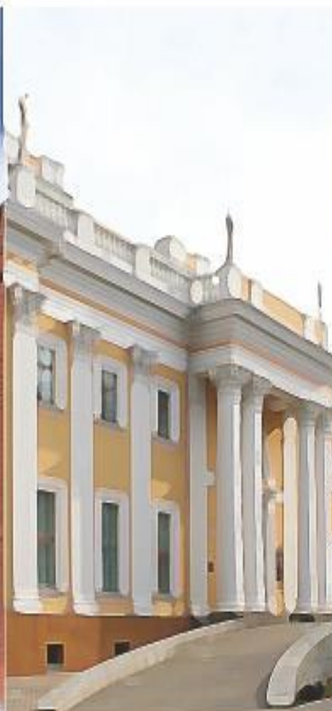
Гомельский дворцово- парковый ансамбль