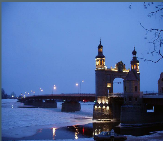
Мост королевы Луизы