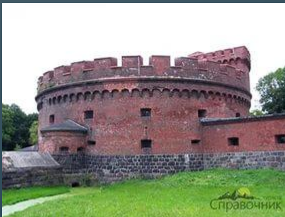
Крепость Фридрихские ворота