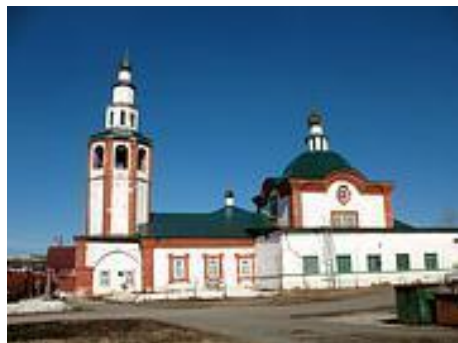
Рис.1. Церковь Иоанна Предтечи (Березники)