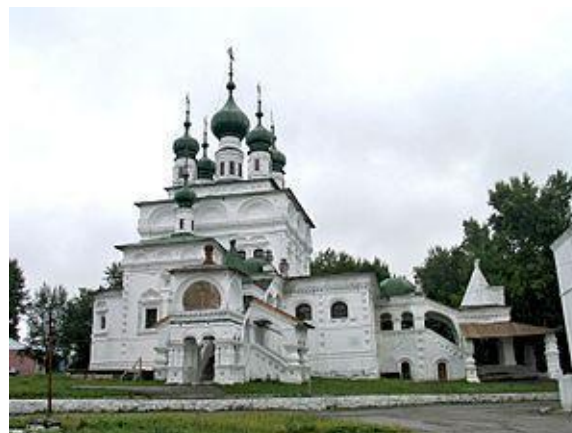
Рис.2. Троицкий собор (Соликамск)