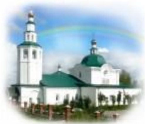
Рис.3. Зырянская крепость (Березники)