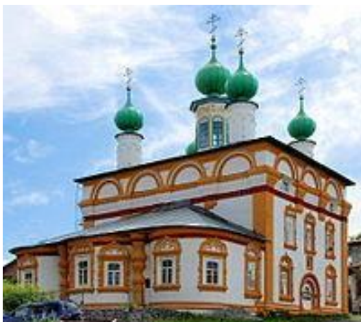
Рис.3. Спасская церковь (Соликамск)