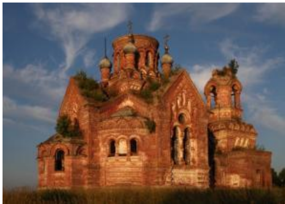
Рис.1. Петропавловская церковь (Усолъе)