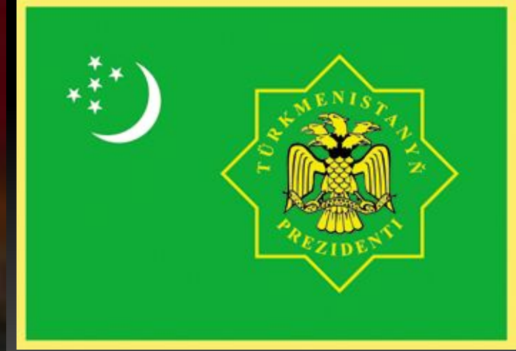
Сапармурат Атаевич Ниязов руководитель Туркмении с 1985 по 2006

Штандарт (флаг) президента Туркменистана утвержден 15 июля 1996 г. Он является важнейшим и главным атрибутом, символизирующим президентскую власть. В ст.54 Конституции закреплено, что «Президент Туркменистана является главой государства и исполнительной власти, высшим должностным лицом государства». Именно штандарт подтверждает роль и значение института президентства в Туркменистане и одновременно подчеркивает осуществление главой государства высшей исполнительной власти в стране. Штандарт (флаг) президента Туркменистана олицетворяет Туркменистан как президентскую республику, провозглашенную в ст.1 Конституции.