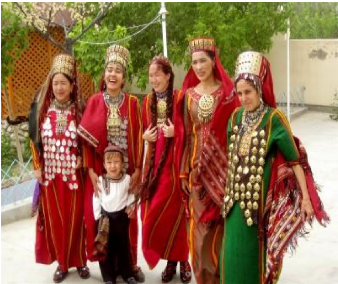
туркмены в национальной одежде

— 5,1 млн. чел., сконцентрировано главным образом в приречных оазисах и предгорной части Копетдага. Огромная площадь Каракумов заселена слабо. Средняя плотность — 10 чел. на 1 кв. км. Среднегодовой прирост в 2000—2006 гг. — 1,4%. Ожидаемая продолжительность жизни — около 64 лет (2005 г.). 85% населения составляют туркмены, 5% — узбеки, 4% — русские, 2% — казахи. Официальный язык — туркменский, на нем говорят 72% населения (12% — на русском). 89% населения относятся к мусульманам, 9% — к православным. Согласно данным за 1999 г. грамотного 98% взрослого населения.