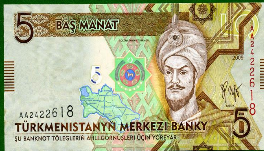
Манат - денежная единица Туркмении