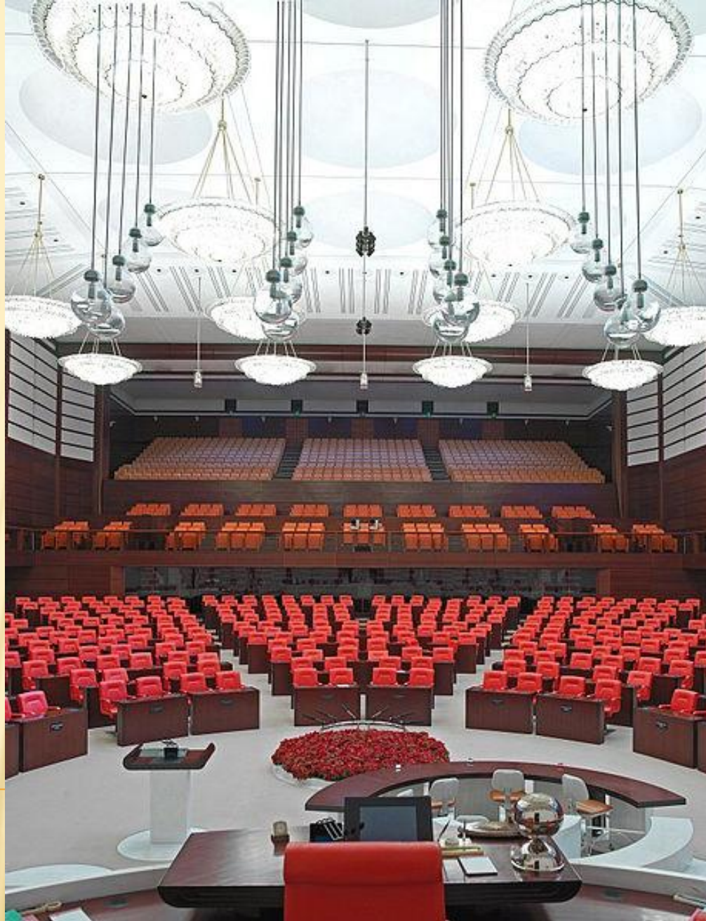
Великое национальное собрание Турции