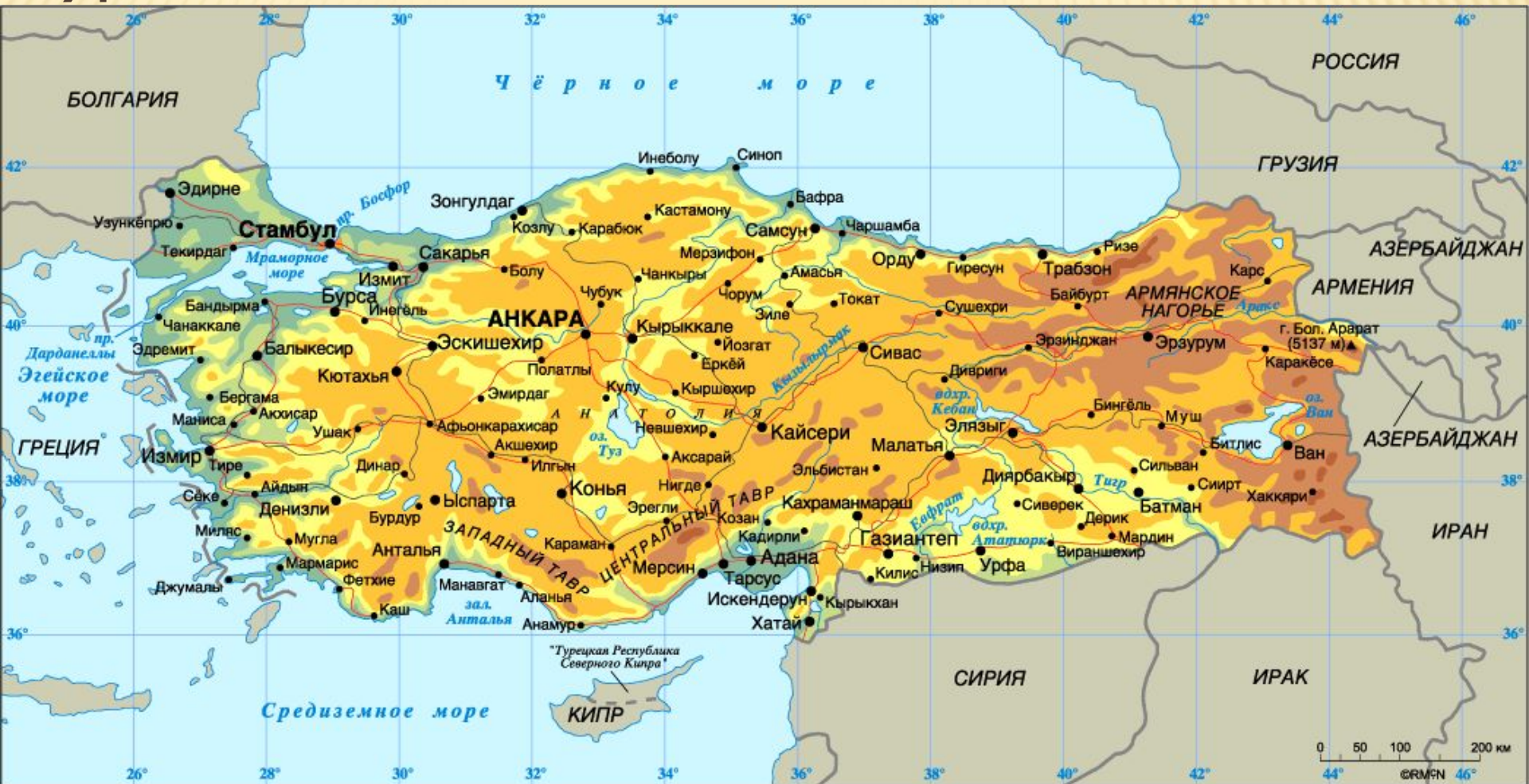
Турция на карте