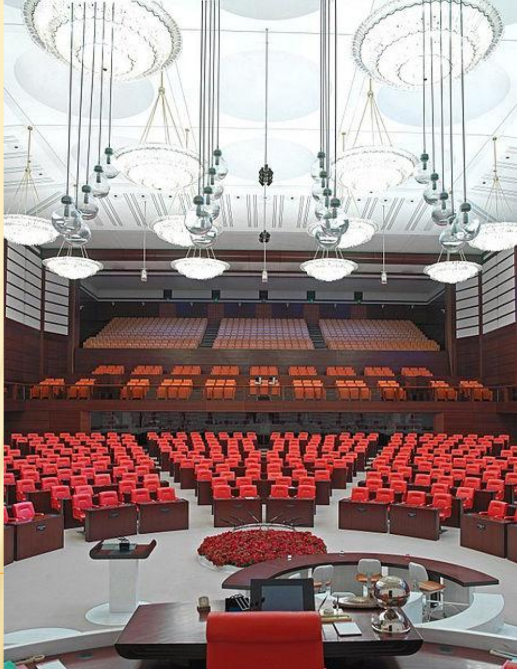
Великое национальное собрание Турции