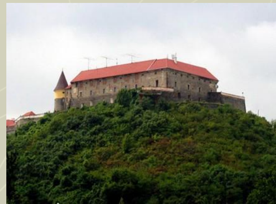
православная семинария на о. Халки