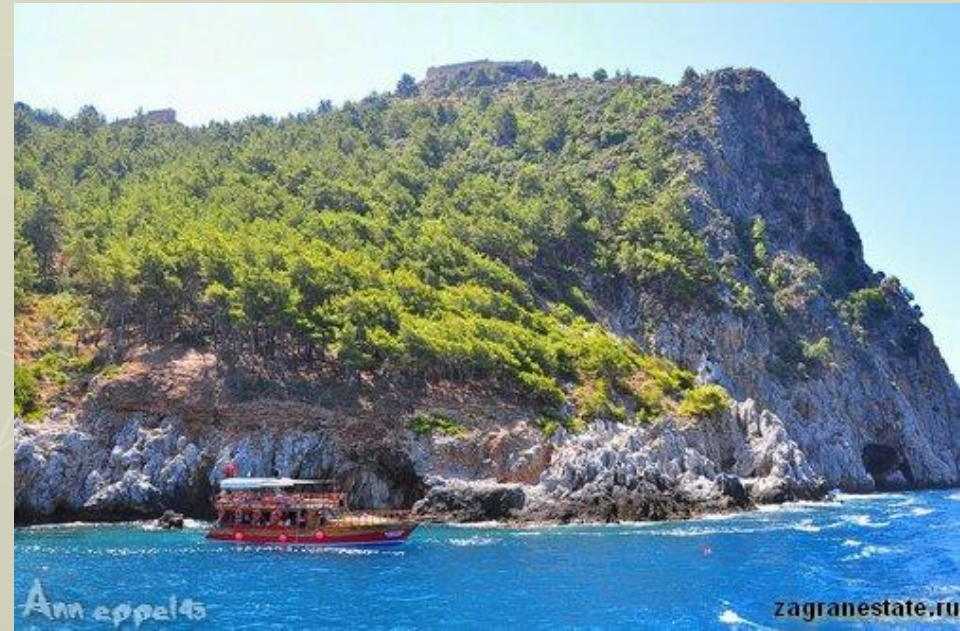
► побережье Эгейского моря

Турция — страна преимущественно горная. В связи с этим климат страны носит в среднем горный характер и черты континентального климата. Лето в Турции повсеместно жаркое и засушливое, зимы снежные и холодные. На Эгейском и Средиземном море климат средиземноморский, с более мягкой зимой, устойчивый снежный покров не образуется. На Чёрном море климат умеренно-морской с характерными для него тёплым летом и прохладной зимой. Температура зимой (в январе) составляет примерно +5\text{ }^{\circ}\text{C} , летом (в июле) — около +23\text{ }^{\circ}\text{C} . Осадков выпадает до 1000—2500 мм в год.