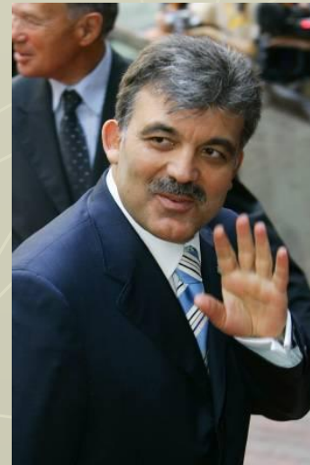
Президент Турции Абдулла Гюль