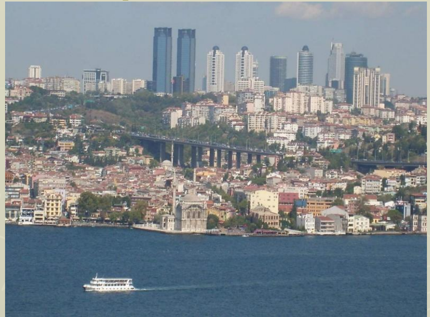
Стамбул, самый густонаселённый город

Распределение жителей по территории Турции крайне неравномерно. Наиболее густо заселены побережья Мраморного и Чёрного морей, а также районы, прилегающие к Эгейскому морю. Самый густонаселённый город — Стамбул и самый малонаселённый район — Хаккяри.