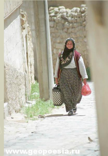
национальная турецкая одежда