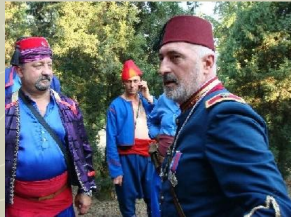
Хаккяри – Самый малонаселённый район