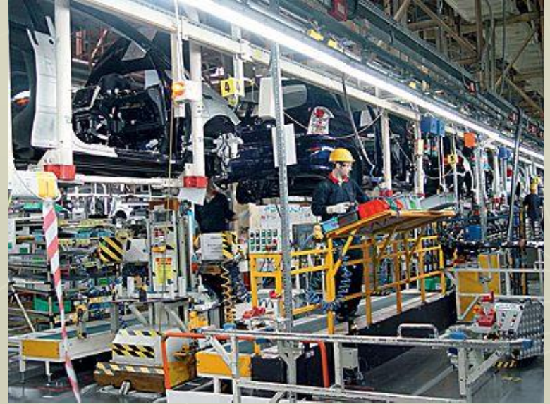
Завод Toyota в Турции.

Развиты текстильная, кожевенная, пищевая, химическая, фармацевтическая отрасли, энергетика, металлургия, судостроение, автомобилестроение и производство электробытовых товаров. Динамично развивающейся отраслью является туризм. В настоящее время из-за конкуренции со стороны стран Восточной Азии текстильная промышленность Турции переживает спад. Из наиболее динамичных отраслей можно выделить автомобильную и химическую промышленность.