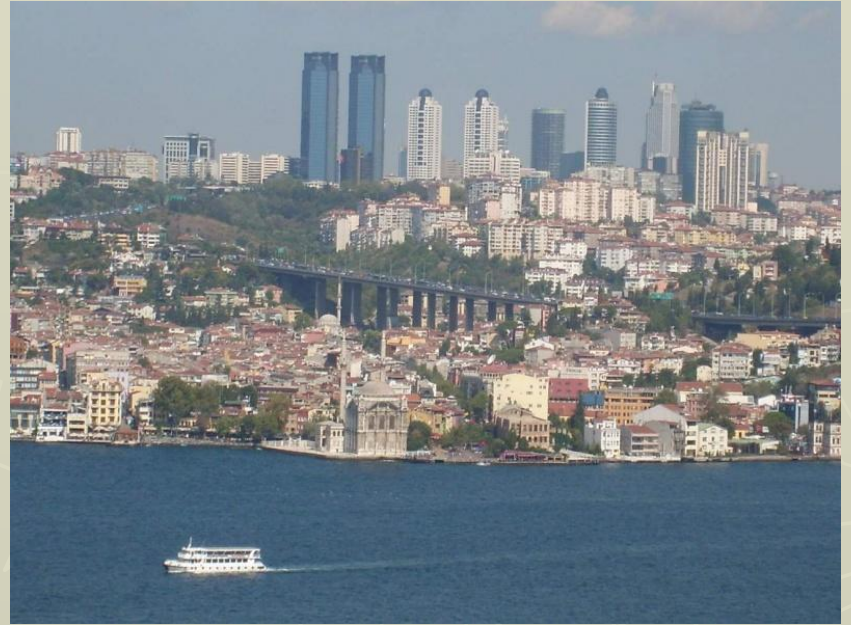
Стамбул, самый густонаселённый город

Распределение жителей по территории Турции крайне неравномерно. Наиболее густо заселены побережья Мраморного и Чёрного морей, а также районы, прилегающие к Эгейскому морю. Самый густонаселённый город — Стамбул и самый малонаселённый район — Хаккяри.