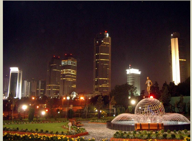
Левент — финансовый район в Стамбуле

в 1990-е гг. быстрый рост после либерализации экономики. Сельское хозяйство почти полностью обеспечивает страну продовольствием. Конкурентоспособные текстильная, перерабатывающая и строительная отрасли. Туризм. Динамично развивающаяся частная экономика. Наличие специалистов. Таможенный союз с ЕС. стабильно высокая инфляция (в 2004 г. 54,4 %). Ненадёжный общественный финансовый сектор. Государственная бюрократия. Неравномерная приватизация. Слабый банковский сектор. Влиятельная организованная преступность. Дорогостоящие военные операции против курдских сепаратистов.