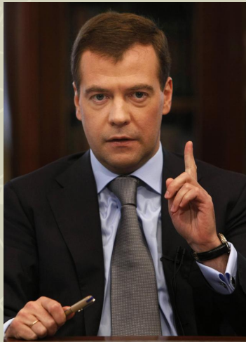
президент россии дмитрий медведев

Российско-турецкие дипломатические отношения были установлены в 1701, когда в Константинополе открылось посольство Российской империи. Хотя двусторонние межгосударственные связи насчитывают более пяти веков — историки ведут отсчёт от послания князя Ивана III по вопросам морской торговли, направленному 30 августа 1492 османскому султану Баязету II.