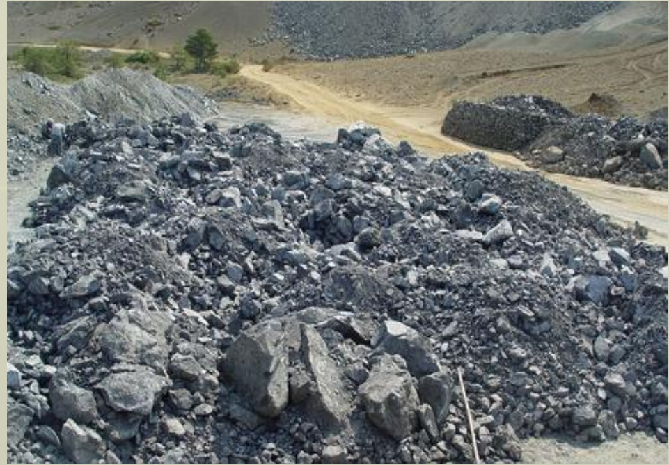
► Залежи хромовой руды

Природные ресурсы Турции ещё недостаточно изучены, тем не менее там обнаружены большие запасы разнообразных полезных ископаемых. В недрах страны залегают каменный и бурый уголь, нефть, различные рудные ископаемые: железо, свинец, цинк, марганец, ртуть, сурьма, молибден. По запасам хромовой руды Турция занимает второе место в капиталистическом мире. Здесь имеются богатейшие залежи вольфрама, известно около ста месторождений меди. Из нерудных ископаемых известны месторождения селитры, серы, мрамора, морской ненки, поваренной соли.