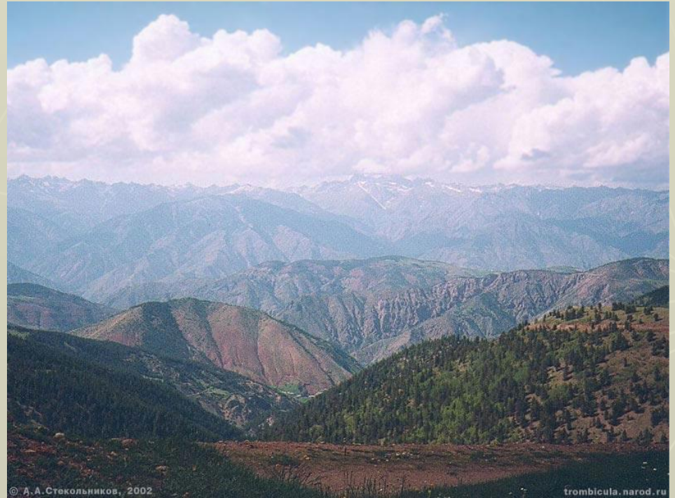
► Понтийские горы

По характеру рельефа Турция — горная страна: средняя высота ее над уровнем моря около 1000 м. Почти вся территория занята Малоазиатским нагорьем, в составе которого различаются окраинные Горы (Понтийские и Тавр) и расположенное между ними Анатолийское плоскогорье. Низменных равнин в стране мало, они приурочены к отдельным участкам морских побережий и к устьям рек.