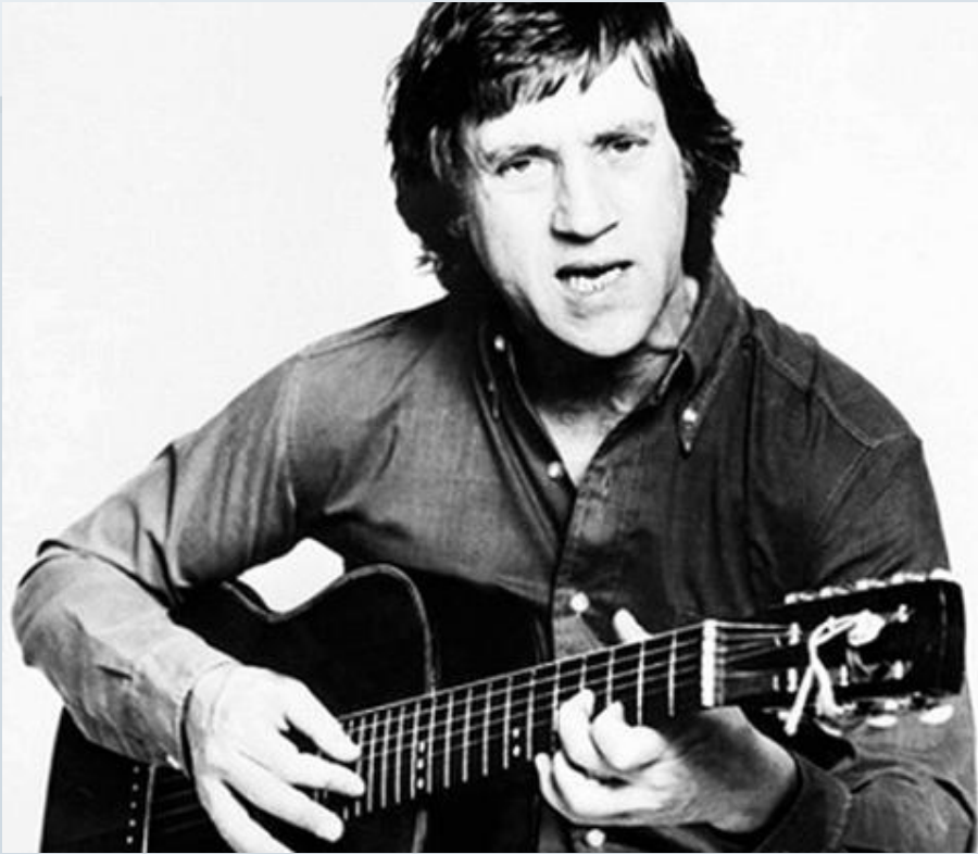
Владимир Семенович Высоцкий

Исполнитель песни об открытии тюменской нефти? И ожила земля, и помню ночью я На той земле танцующих людей... Я счастлив, что превысив полномочия, Мы взяли риск - и вскрыли вены ей!