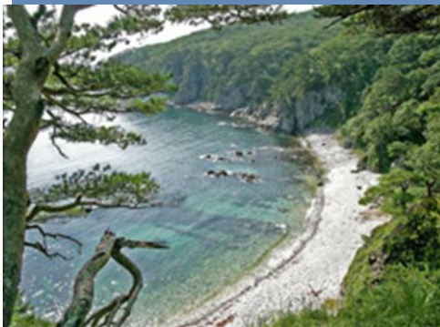
П-ОВ ГАМОВА (Хасанский район).

Полуостров Гамова известен в истории тем, что в 1897 году на камнях у мыса Гамова разбился пароход «Владимир», идущий из Владивостока в китайский порт Чифу с заходом в Посьет. Судно попало в туман и выскочило на отвесную скалу, его нос оказался почти на берегу и получил две пробоины. На сегодняшний день «Владимир» остается погребенным водами залива уже более 100 лет. Только в 1996 году останки судна были найдены приморскими подводниками-поисковиками.