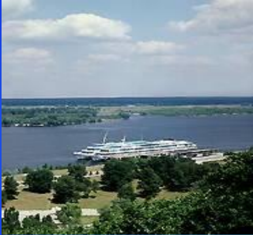
Днепр у г. Канев