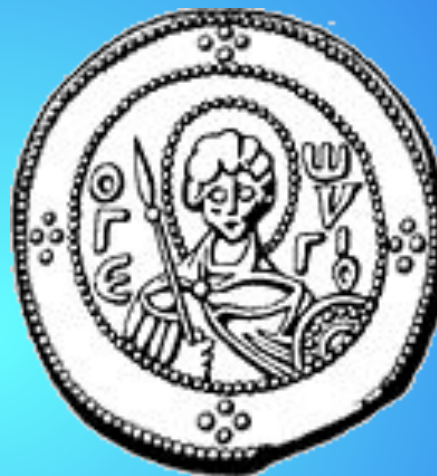
Св. Георгий на сребренике Ярослава Мудрого.