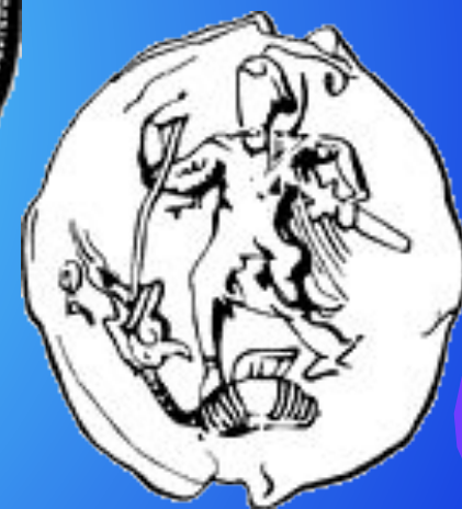
Печать XII века с Архангелом Михаилом.