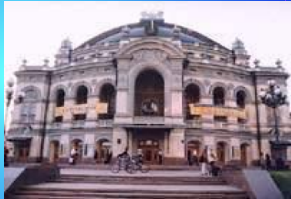
Национальная опера Украины