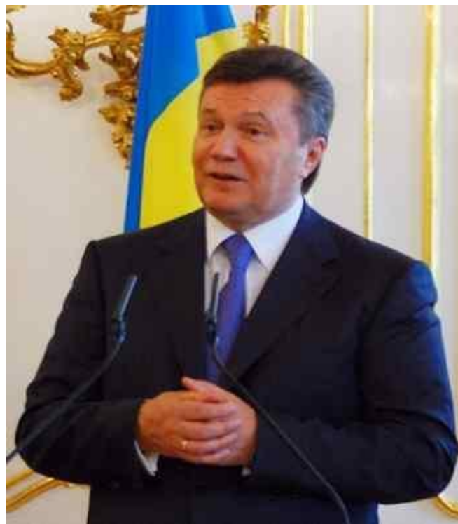
Виктор Фёдорович Янукович. Четвёртый Президент Украины с 25 февраля 2010 года.