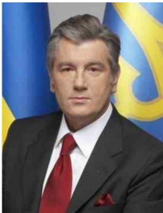
Виктор Андреевич Ющенко. Третий Президент Украины с 2005 по 2010 год.