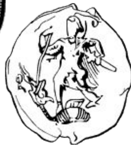
Печать XII века с Архангелом Михаилом.