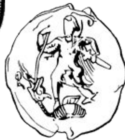
Печать XII века с Архангелом Михаилом.