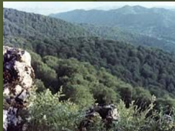
Карпатский заповедник. Склоны гор