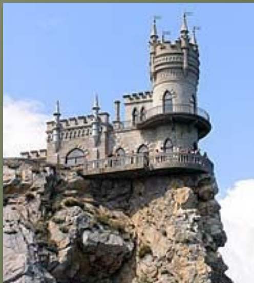
Замок «Ласточкино гнездо» близ Ялты.