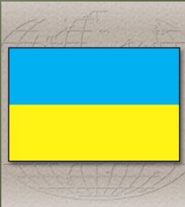
Флаг Украины, принятый 28 января 1992 года.