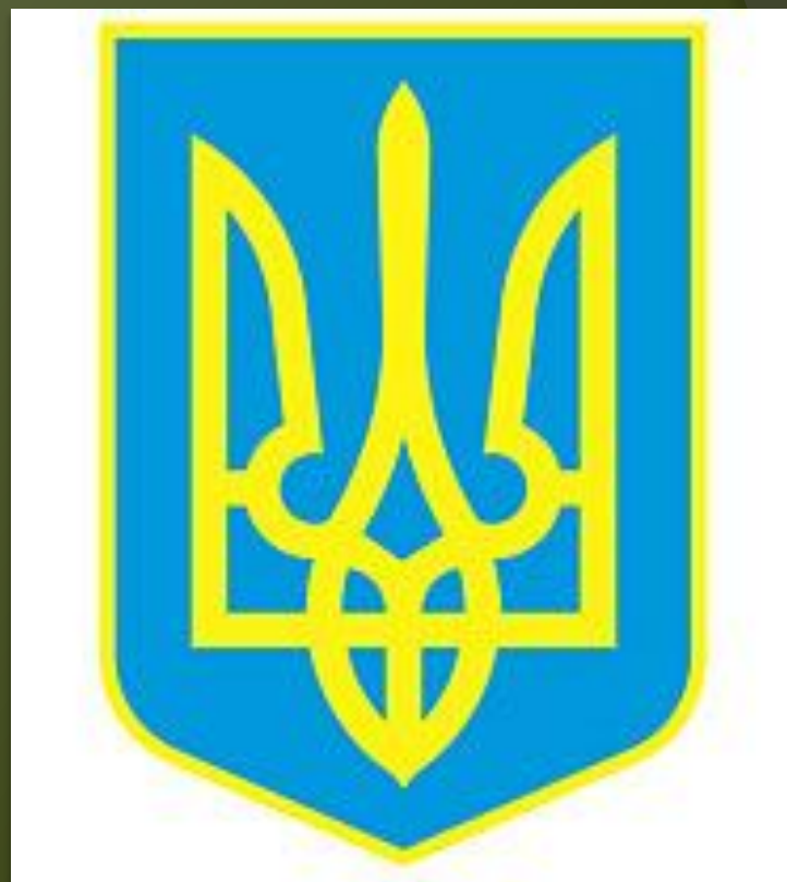
Малый герб Украины представляет собой синий щит с золотым трезубцем.