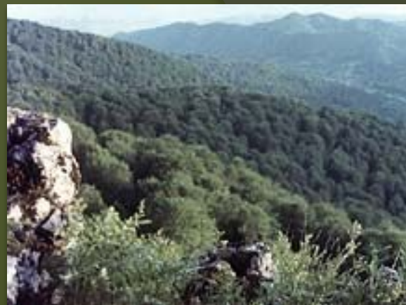
Карпатский заповедник. Склоны гор