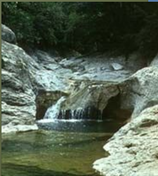
Горный ручей. Большой каньон. Крым.