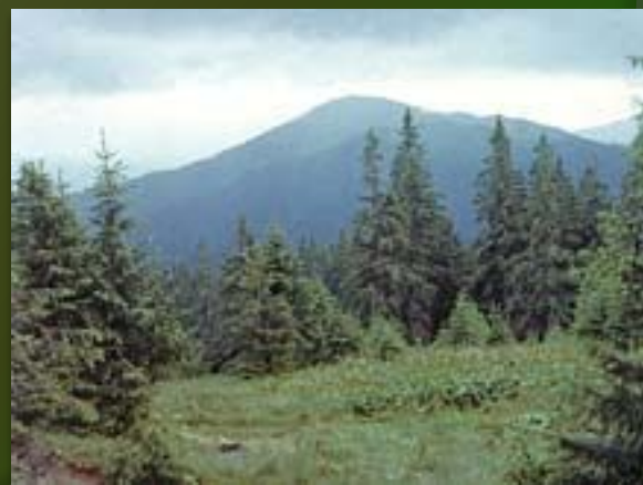
Карпатский заповедник. Панорама.