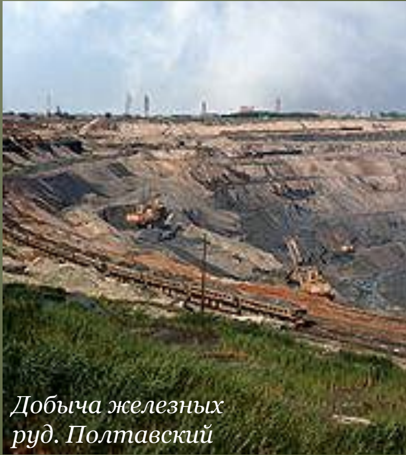
Добыча железных руд. Полтавский горно-обогатительный комбинат.