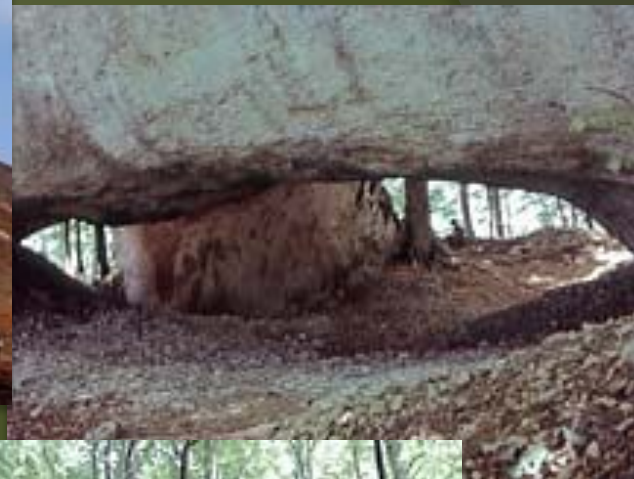
Карпатский заповедник. Каменные ворота.