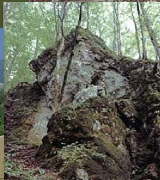
Карпатский заповедник. Горный лес.