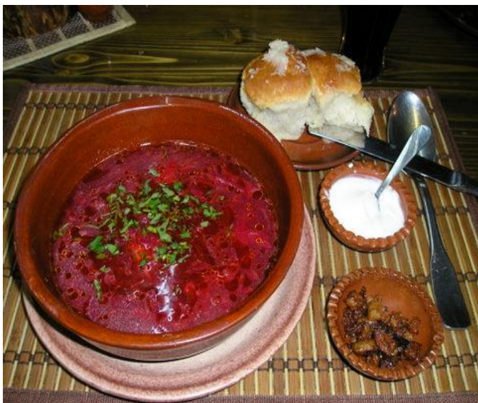
Борщ с пампушками.

Украинская кúхня складывалась на протяжении многих веков. На всей территории современной Украины она остаётся достаточно однородной как по применяемому набору продуктов, так и по способам их переработки. Некоторые её блюда получили широкое распространение среди других народов, особенно славянских, как восточных, так и западных.