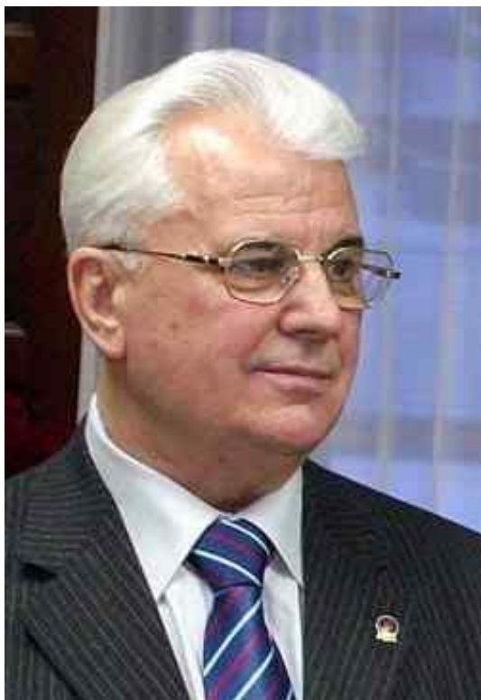
Леонид Макарович Кравчук. В 1991—1994г.г. — первый Президент Украины .