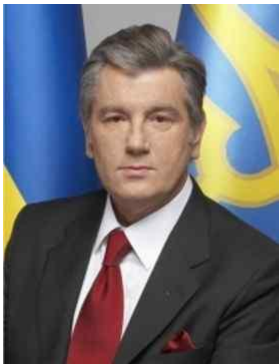
Виктор Андреевич Ющенко. Третий Президент Украины с 2005 по 2010 год.