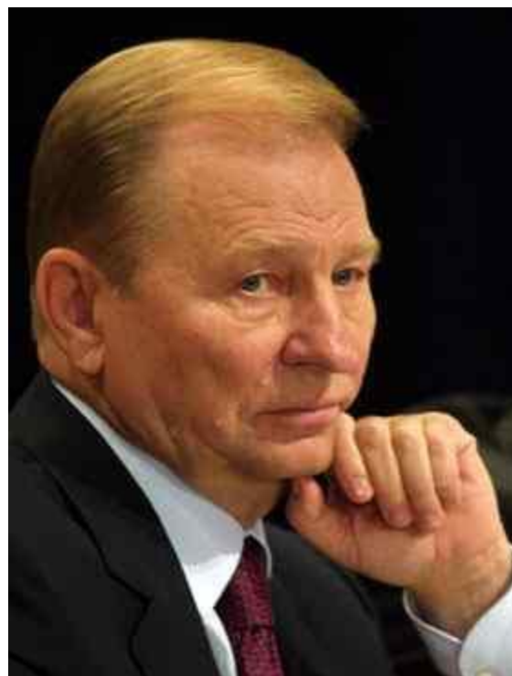
Леонид Данилович Кучма. В 1994—2005 — второй Президент Украины.