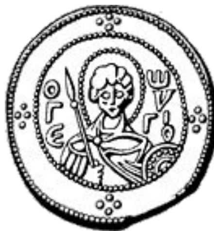
Св. Георгий на сребренике Ярослава Мудрого.