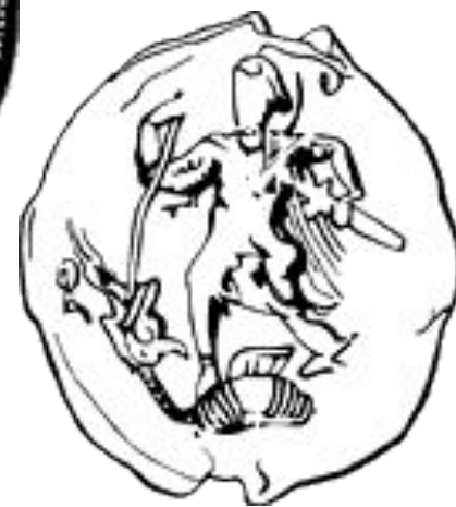
Печать XII века с Архангелом Михаилом.