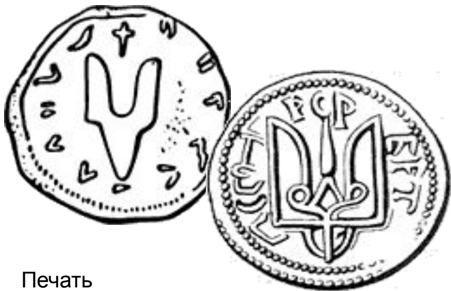
Печать Святослава Игоревича. Киев, до 972 г.