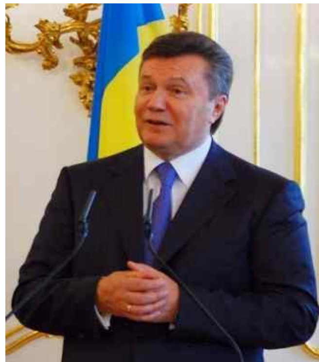
Виктор Фёдорович Янукович. Четвёртый Президент Украины с 25 февраля 2010 года.