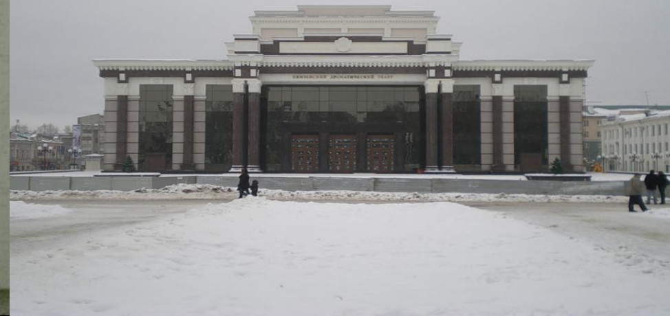
Новый восстановленный драмтеатр