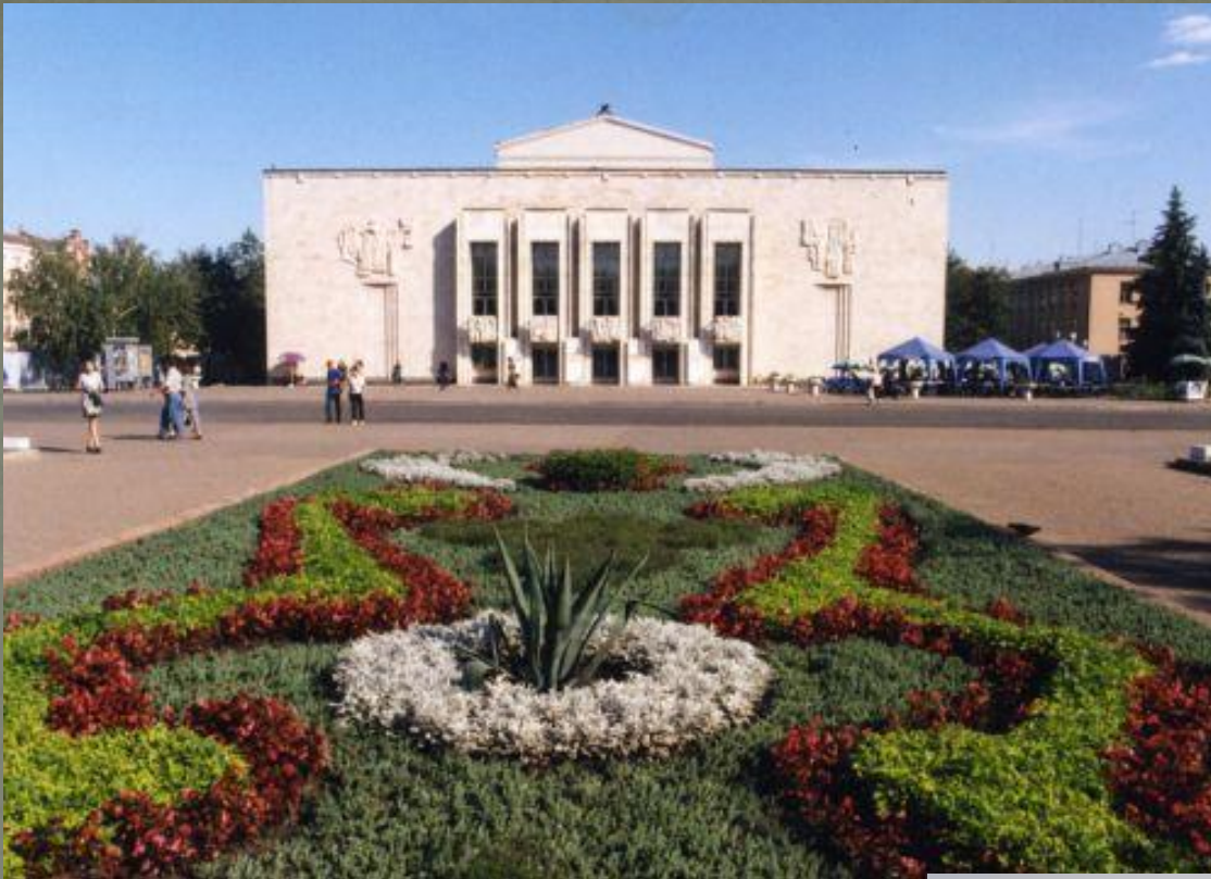
Драм театр до пожара 2008