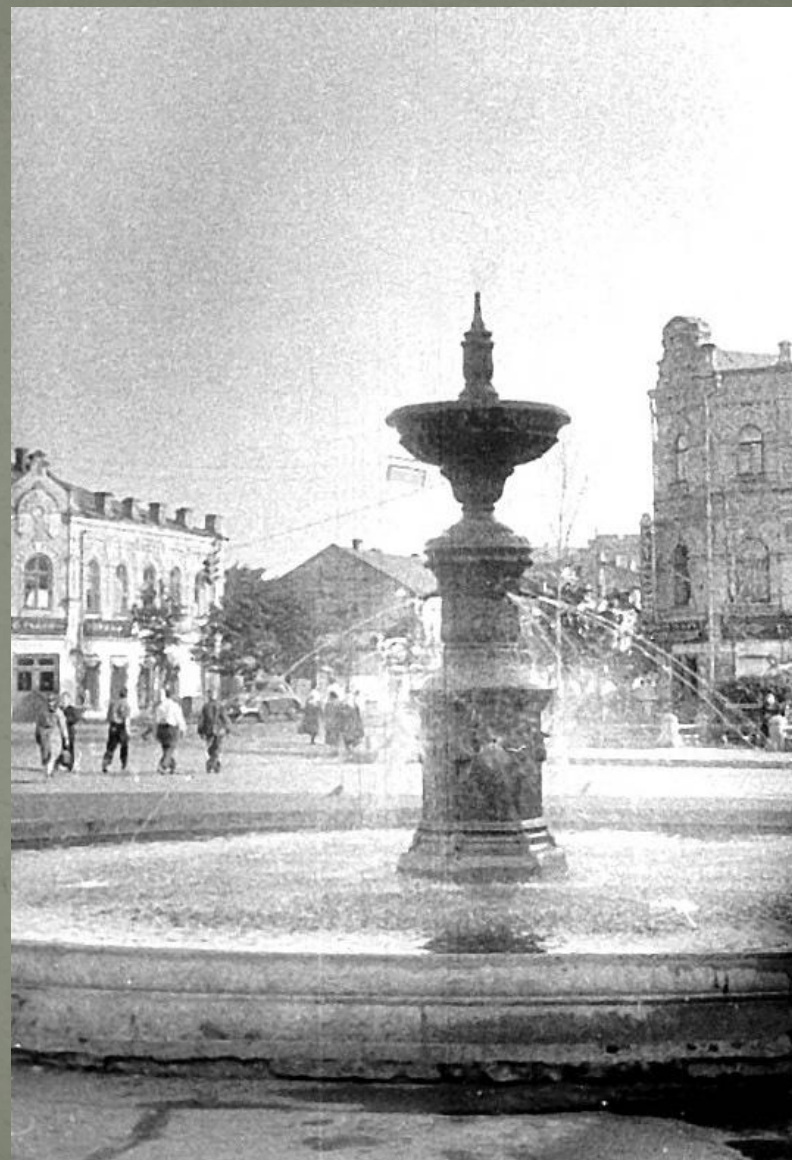
Фонтан возле драм театра