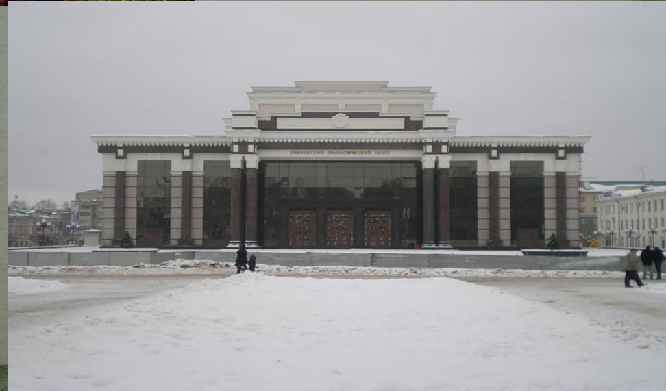
Новый восстановленный драмтеатр