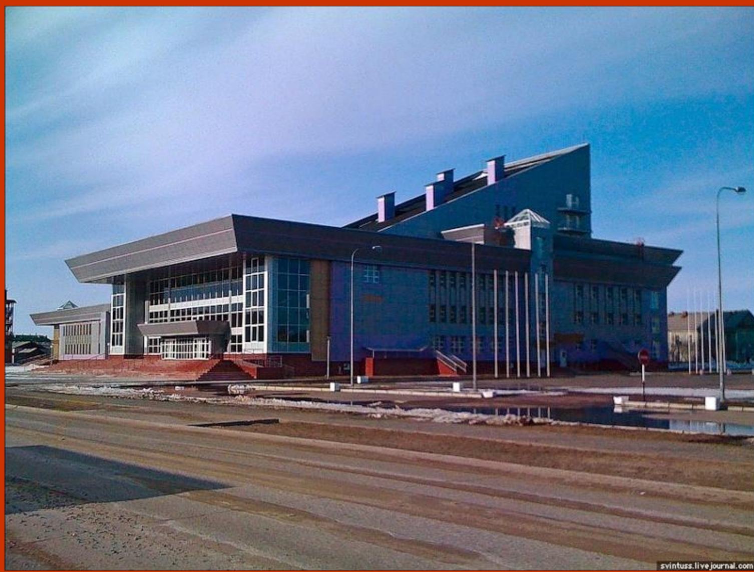
Культурно – деловой центр «Арктика»