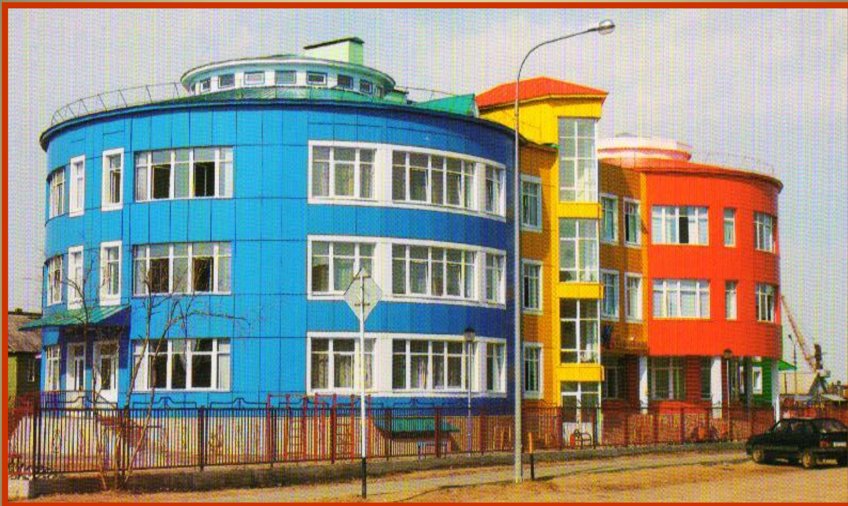
Детский сад «Семицветик»