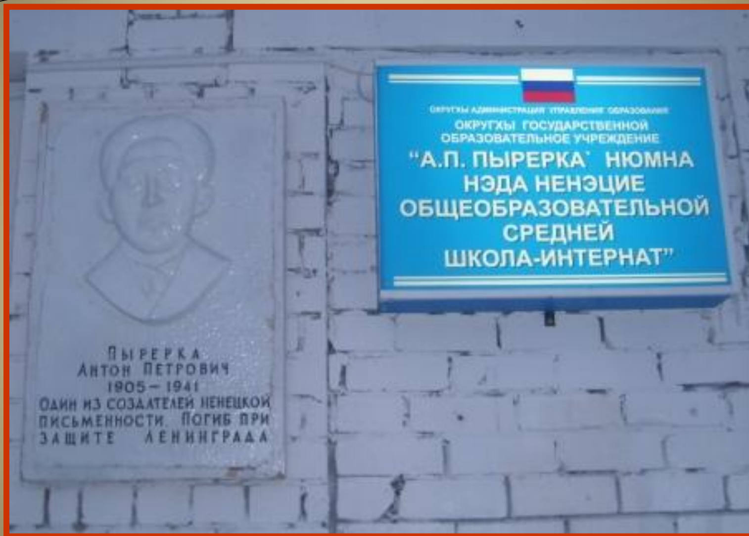
Памятная доска на здании НШИ