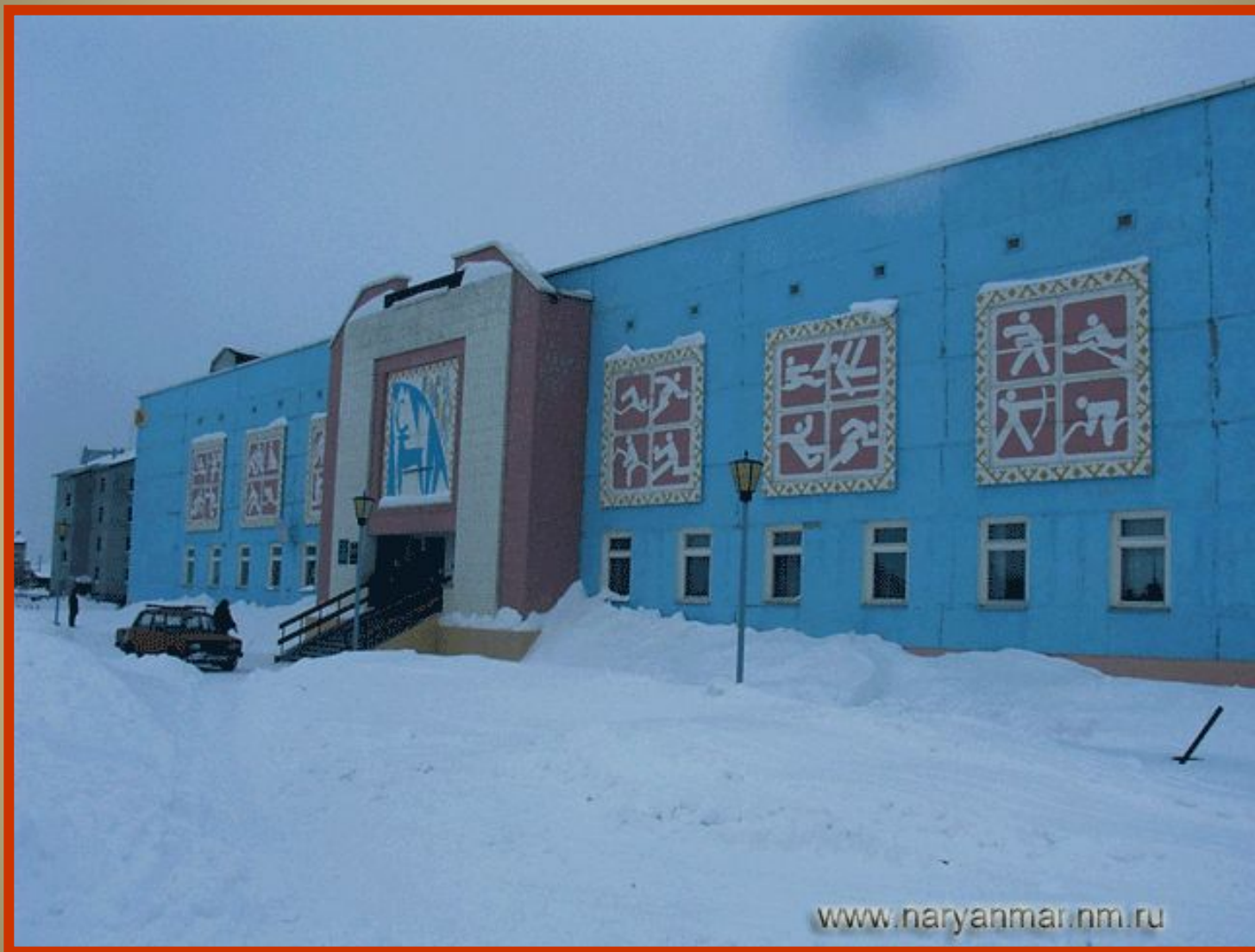
Детский юношеский центр «Лидер»