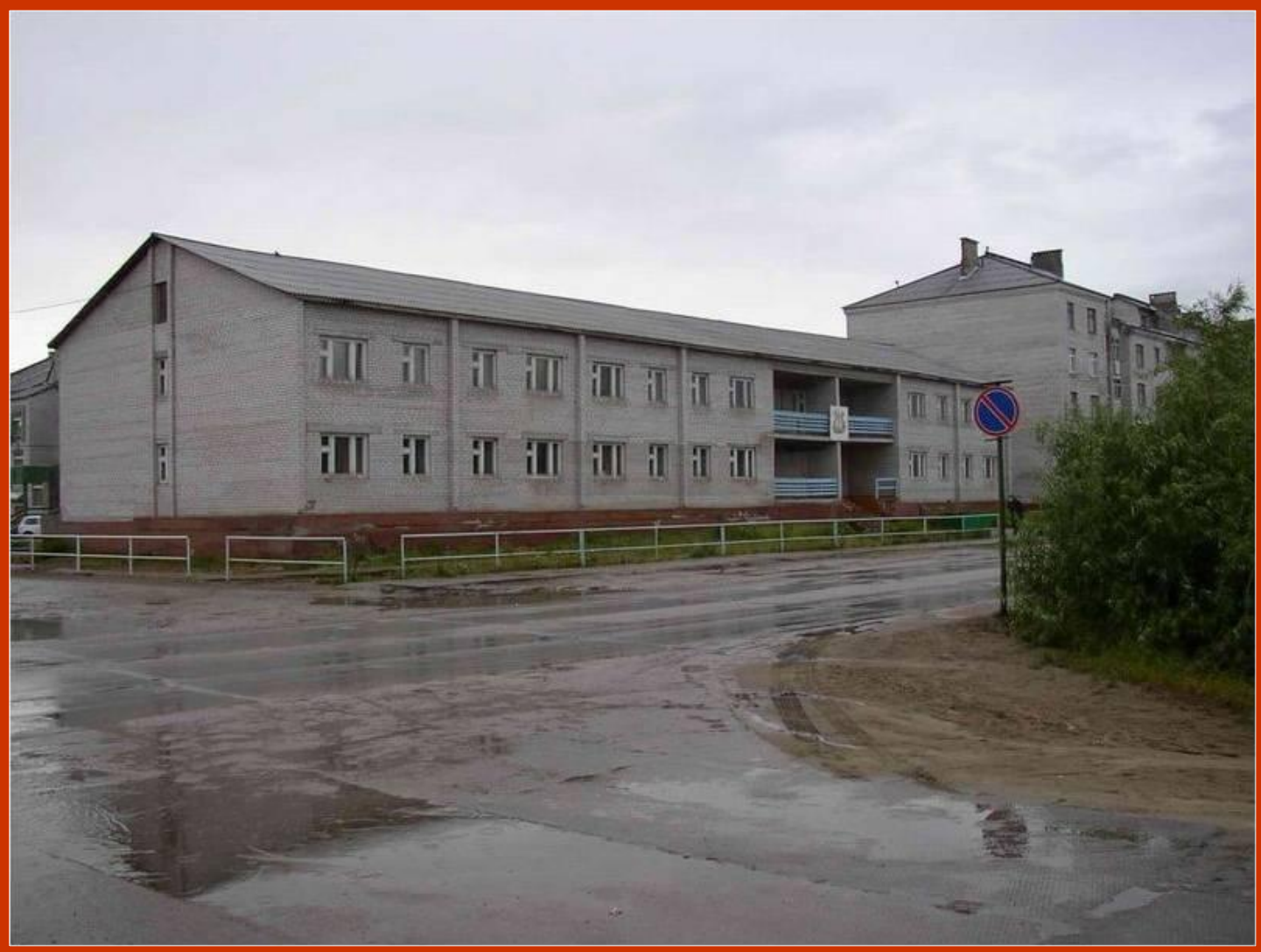
Детская школа искусств