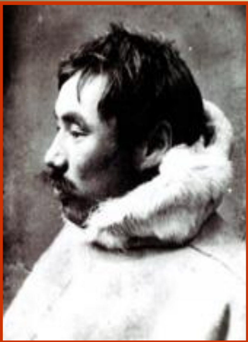
Вылка Илья Константинович (Тыко Вылка)