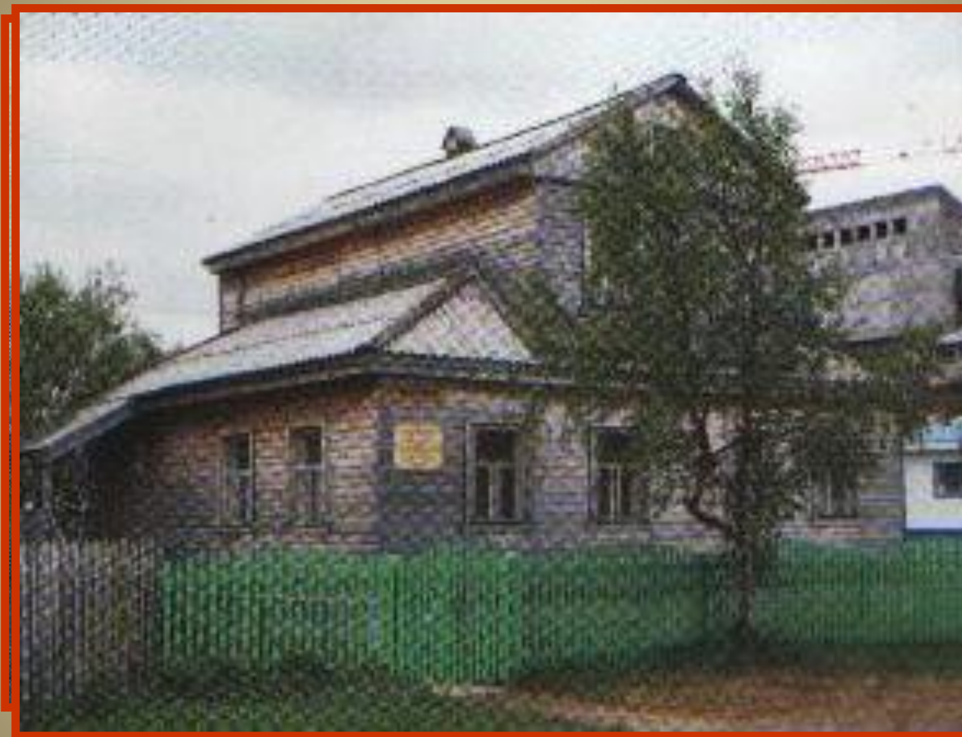
Музей истории и культуры Пустозерска Дом Щевелёвых