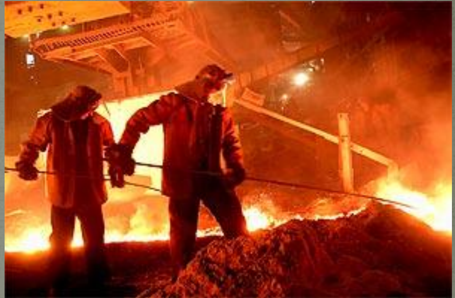
Магнитогорский металлургический комбинат