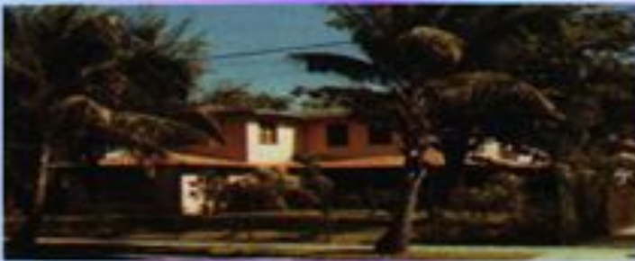
Субгородная резиденция – типичное явление в окрестностях крупных городов

1. В экономически развитых странах, где высокий уровень урбанизации, доля городского населения растет сравнительно медленно, урбанизация развивается «вглубь». Наблюдается процесс субурбанизации.