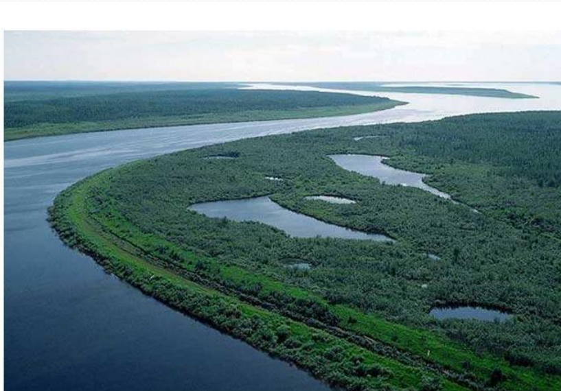
Река Енисей, Россия