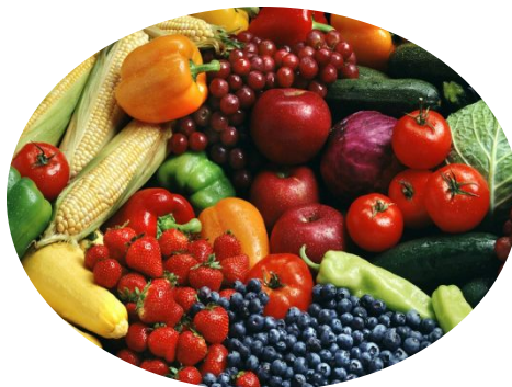
Фрукты, овощи (славятся дыни и виноград)