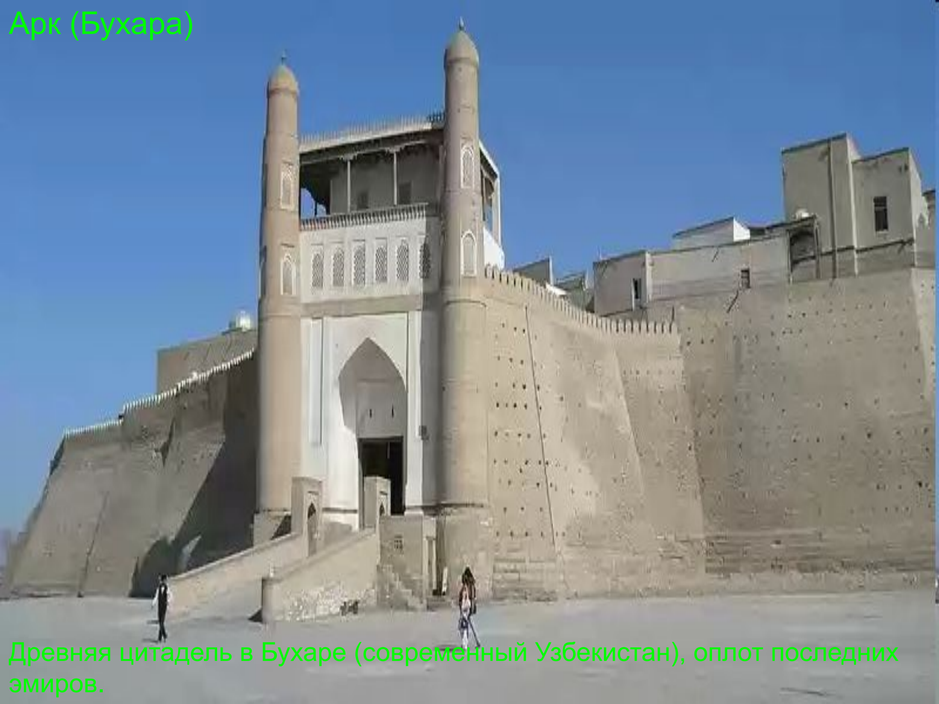
Древняя цитадель в Бухаре (современный Узбекистан), оплот последних эмиров.