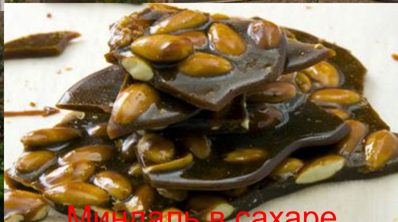
Миндаль в сахаре