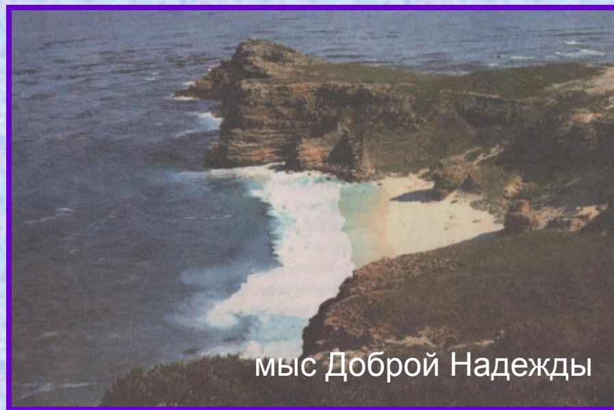
мыс Доброй Надежды

В то время как Христофор Колумб пребывал в полной уверенности, что морем достиг Индии, это совершил Васко да Гама. Мыс Доброй Надежды на юге Африки, откуда он начал свой опасный путь, оправдал своё название: была решена величайшая географическая задача – найден морской путь в обход Африки. Заодно существенно пополнились знания европейцев о восточном побережье африканского материка.