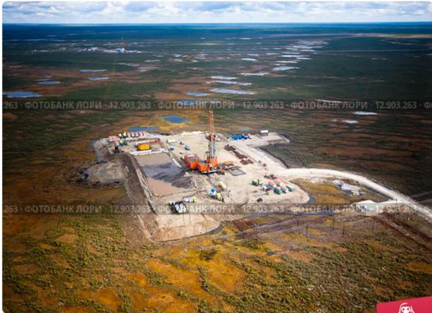
Буровая вышка в Сибири, среди болота, вид сверху