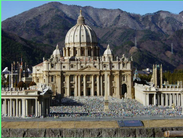
Собор Святого Петра