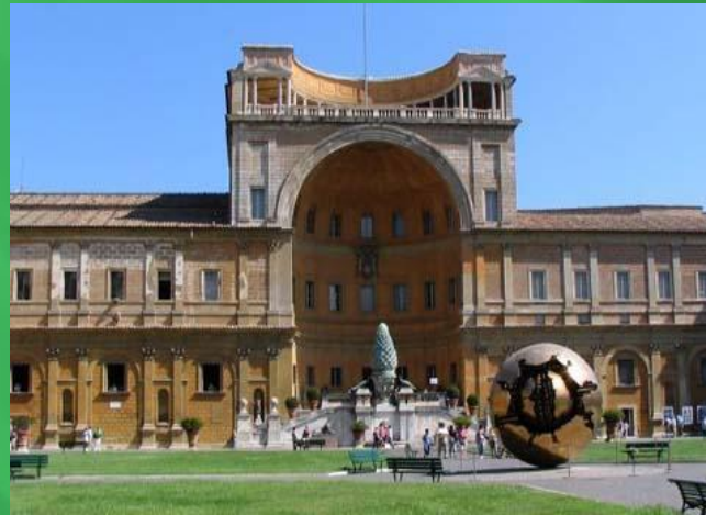
Апостольский дворцовый комплекс