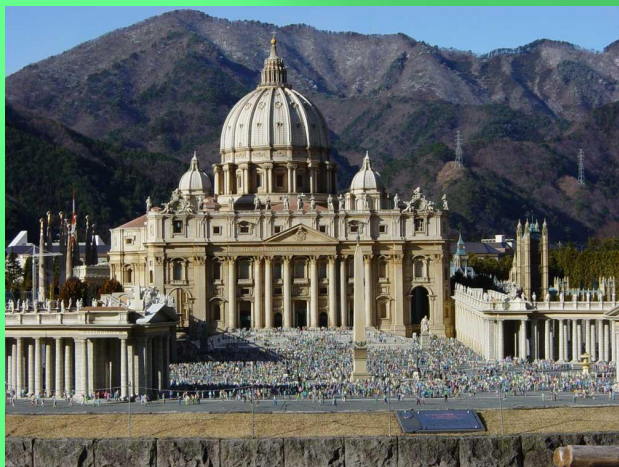
Собор Святого Петра