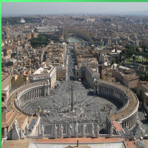
Площадь Святого Петра