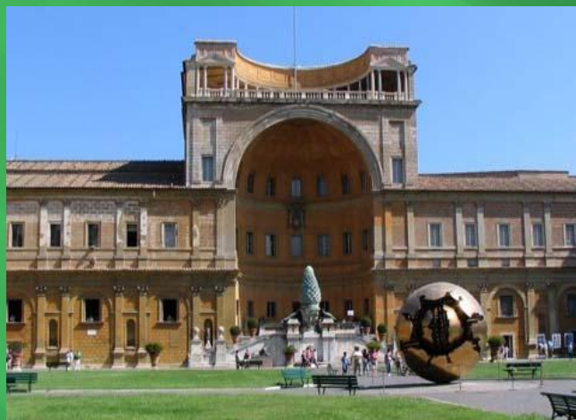
Апостольский дворцовый комплекс