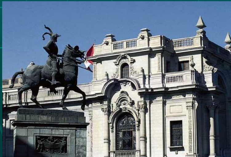
Конная статуя Писарро в Лиме Перу