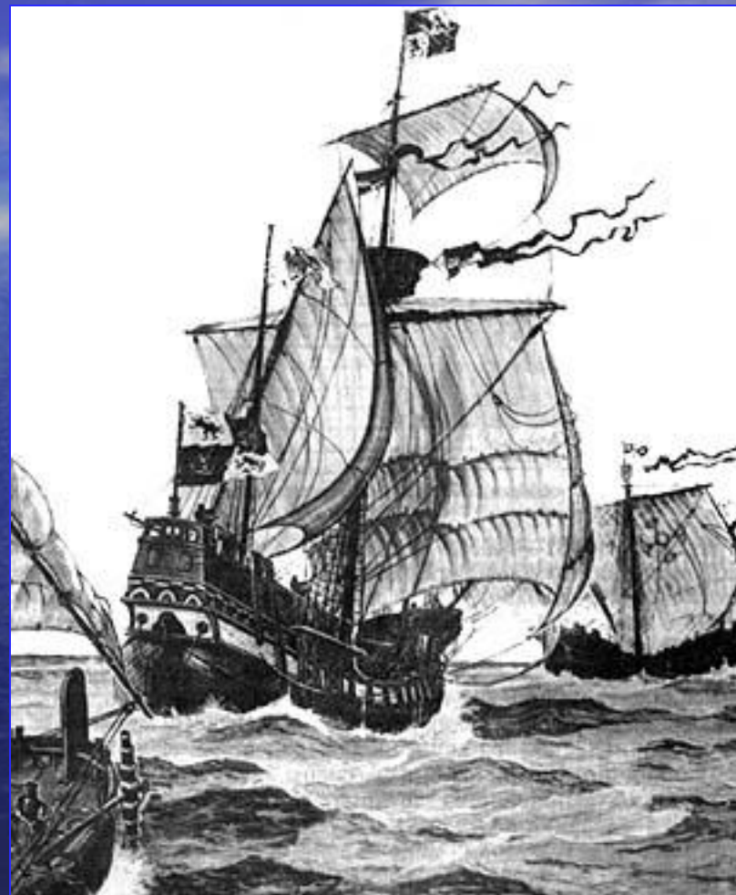
Корабли экспедиции Христофора

Росло число врагов Колумба среди дворян, недовольных тем, что он сурово карал участников экспедиции за непослушание. В 1500 г. Колумб был смещен со своего поста и в оковах отправлен в Испанию. Ему удалось восстановить свое доброе имя и совершить еще одно путешествие в Америку. Однако после возвращения из последнего путешествия он был лишен всех доходов и привилегий и умер в бедности.