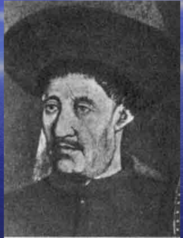
Принц Генрих (Энрике), прозванный мореплавателем, - организатор дальних

Великие географические открытия стали возможными в результате значительных успехов в развитии науки и техники в Европе. В конце 15 века широкое распространение получило учение о шарообразности Земли, расширились знания в области астрономии и географии. Были усовершенствованы навигационные приборы (компас, астрольбия), появился новый тип парусного судна – каравелла.