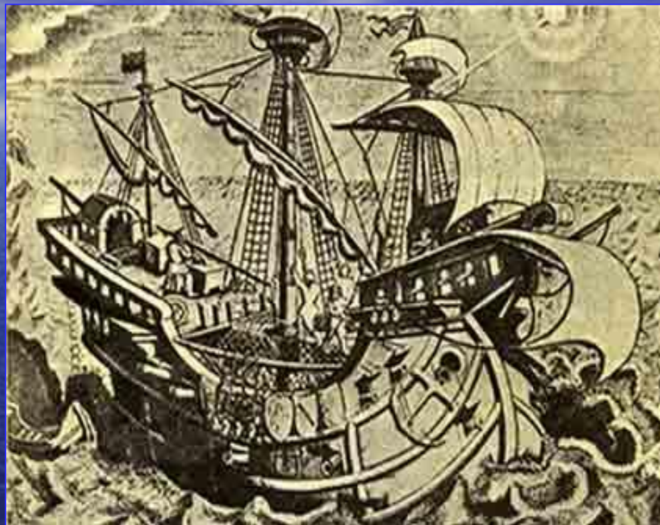
Один из кораблей флотилии Магеллана. Рисунок 1523 г.