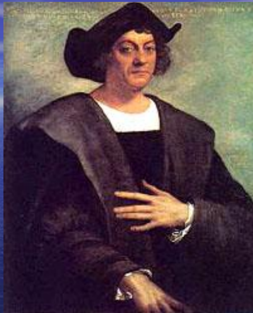
Христофор Колумб (1451-1506г.г.) С его именем связано открытие Америки