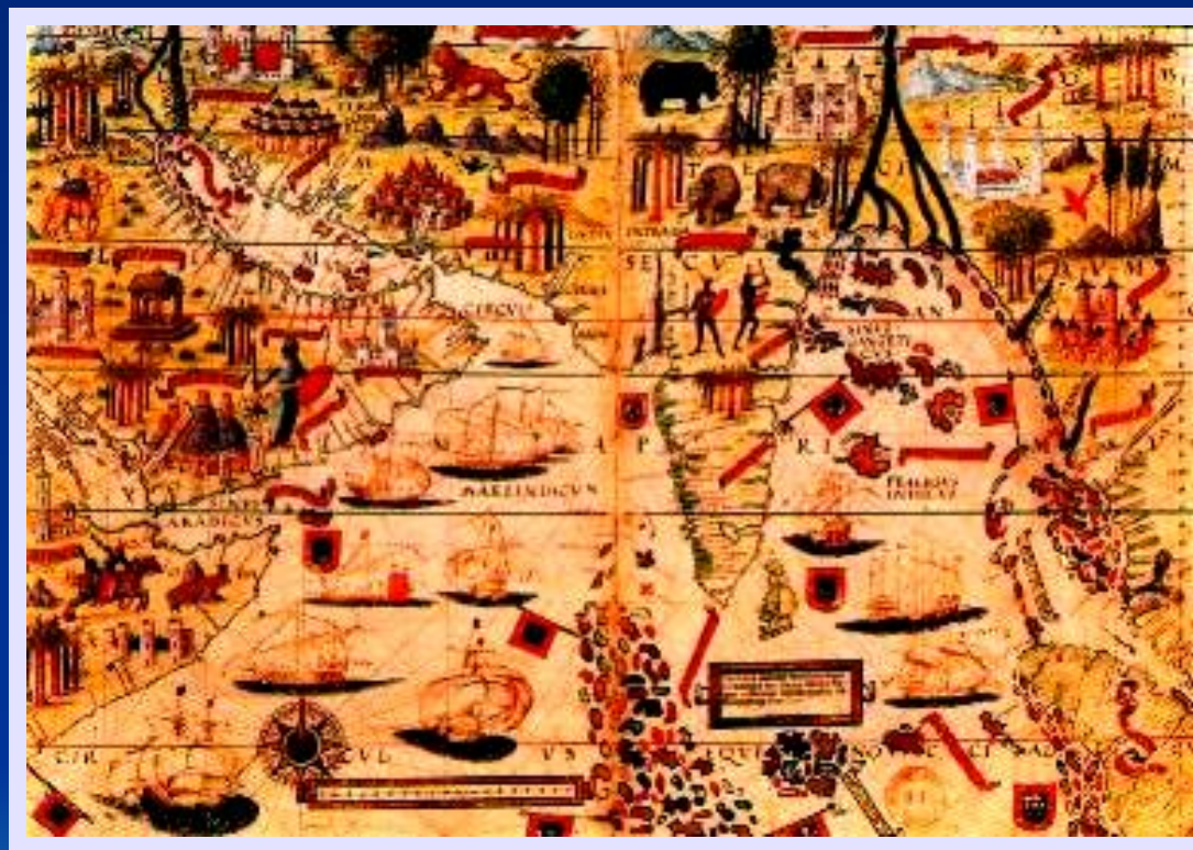
Лопо Хомем. Португальский морской атлас.1519 г.

Восточные товары стоили в 10 раз дороже. Поэтому европейцы стали искать пути в загадочную Индию, богатейшую страну того времени