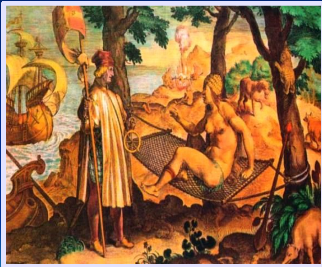
Теодор де Бри Америго Веспуччи Миниатюра 16 в.

Колумб был уверен, что открыл путь в Индию. Только экспедиция Америго Веспуччи доказала, что это - новый материк. Он получил имя - Америка. Испанцы и португальцы задались вопросом: «А что же дальше на Западе»?