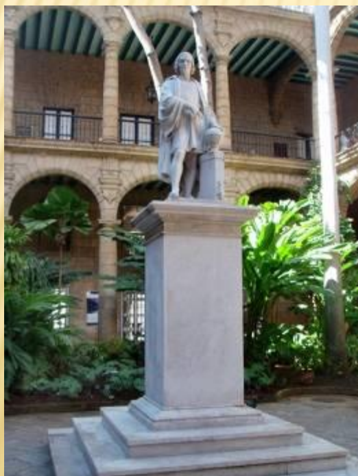
Памятники Х. Колумбу

Умер Колумб в испанском городе Вальядолиде 21 мая 1506 в присутствии брата Диего, сыновей Диего, Эрнандо и нескольких друзей по экспедиции. Его останки были перевезены в Севилью в 1513, а затем примерно в 1542, перезахоронены в соборе города Санто-Доминго (ныне Доминиканская Республика).