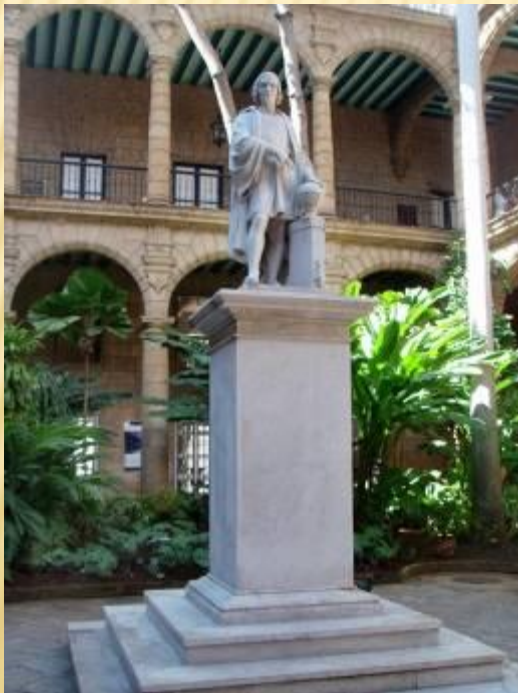
Памятники Х. Колумбу

Умер Колумб в испанском городе Вальядолиде 21 мая 1506 в присутствии брата Диего, сыновей Диего, Эрнандо и нескольких друзей по экспедиции. Его останки были перевезены в Севилью в 1513, а затем примерно в 1542, перезахоронены в соборе города Санто-Доминго (ныне Доминиканская Республика).